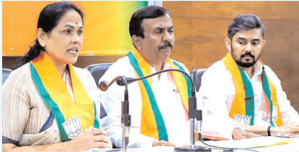
बंगलूरु में केंद्रीय राज्य मंत्री शोभा करंदलाजे शुक्रवार को बंगलूरु के जगन्नाथ भवन में एक प्रेस कॉन्फ्रेंस को संबोधित करती हुई।

दक्षिण भारत राष्ट्रमत dakshinbharat.com बंगलूरु। केंद्रीय सूक्ष्म, लघु एवं मध्यम उद्यम तथा श्रम एवं रोजगार राज्य मंत्री शोभा करंदलाजे ने कर्नाटक में मतदाता सूची के विशेष घन पुनरीक्षण (स्पेशल इंटेन्सिव रिवीजन-एसआईआर) की प्रक्रिया में कथित अनियमितताओं को लेकर शुक्रवार को भारत निर्वाचन आयोग (ईसीआई) के मुख्य चुनाव आयुक्त को पत्र लिखकर तत्काल हस्तक्षेप की मांग की। करंदलाजे ने अपने पत्र में आरोप लगाया कि राज्य में निर्वाचन आयोग द्वारा निर्धारित घर-घर जाकर सत्यापन (डोर-टू-डोर वेरिफिकेशन) की अनिवार्य प्रक्रिया का पालन करने के बजाय कई स्थानों पर सामुदायिक भवनों और अन्य सार्वजनिक स्थानों पर शिथिल लगाकर गणना प्रघन (एन्यूमरेशन फॉर्म) वितरित किए जा रहे हैं। उन्होंने निर्वाचन आयोग से मांग की कि पूरे कर्नाटक में चल रहे एसआईआर अभियान की जांच कर यह सुनिश्चित किया जाए कि बूथ लेवल अधिकारियों (बीएलओ) द्वारा किए जाने वाले अनिवार्य घर-घर सत्यापन की प्रक्रिया को कहीं शिथिल आधारित सत्यापन से प्रतिस्थापित या कमजोर तो नहीं किया जा रहा है।