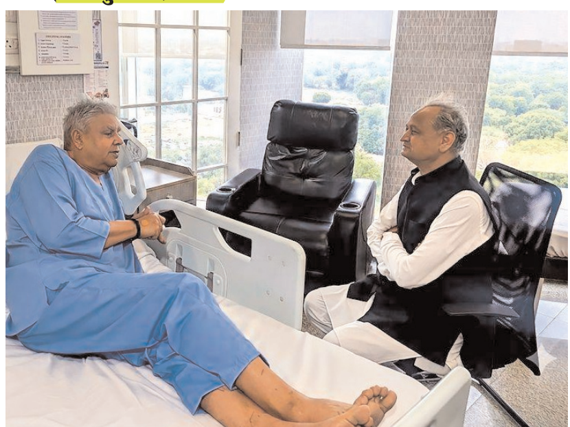
राजस्थान के पूर्व मुख्यमंत्री अशोक गहलोत ने शुक्रवार को जयपुर के ईएचसीसी अस्पताल में पूर्व उपराष्ट्रपति जगदीप धनखड़ से मुलाकात की और उनके स्वास्थ्य का हालचाल जाना।