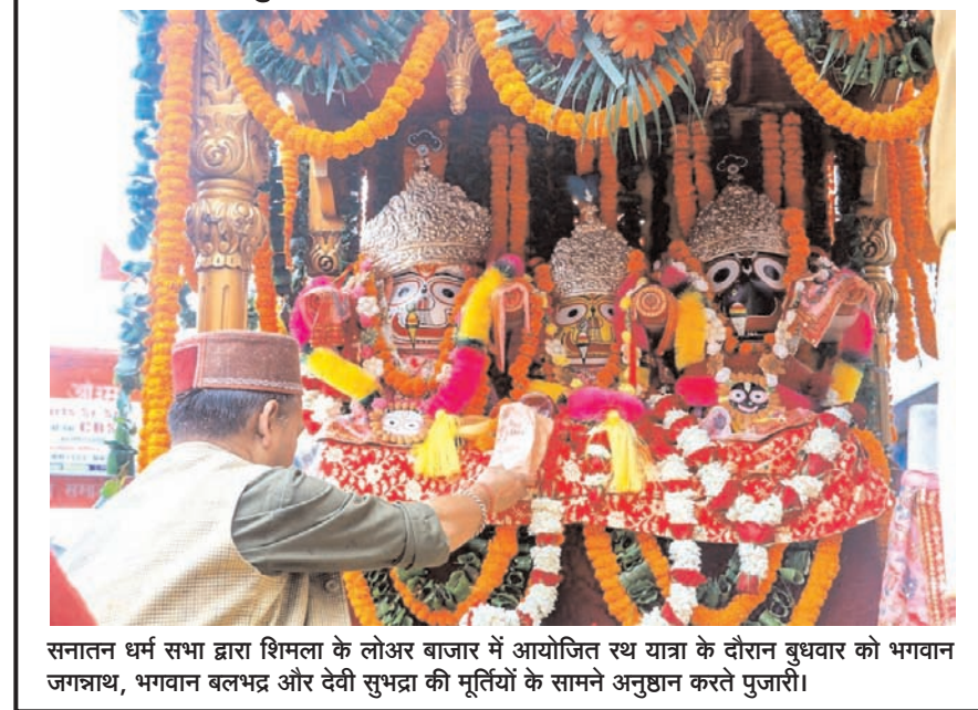
सनातन धर्म सभा द्वारा शिमला के लोअर बाजार में आयोजित रथ यात्रा के दौरान बुधवार को भगवान जगन्नाथ, भगवान बलभद्र और देवी सुभद्रा की मूर्तियों के सामने अनुष्ठान करते पुजारी।