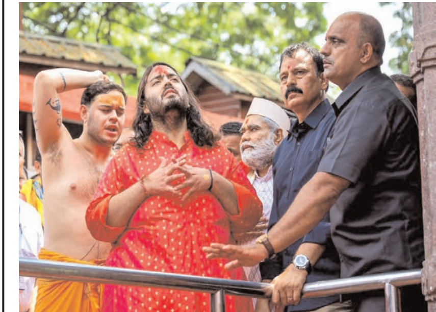
उद्योगपति अनंत अंबानी ने मंगलवार को गुवाहाटी (असम) स्थित ऐतिहासिक शक्तिपीठ मां कामाख्या मंदिर पहुंचकर पूजा-अर्चना की और आशीर्वाद लिया।