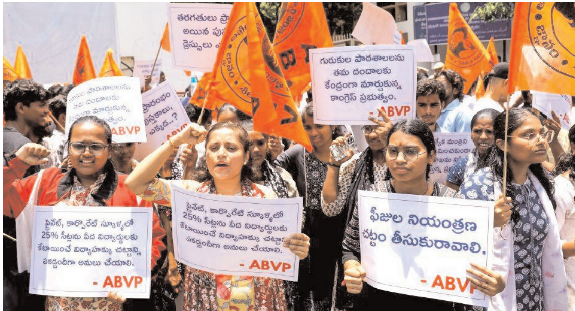
तेलंगाणा की शिक्षा व्यवस्था में सुधार और अपनी विभिन्न मांगों को लेकर सेफाबाद (हेदराबाद) स्थित स्कूल शिक्षा निदेशालय पर प्रदर्शन कर रहे एबीवीपी कार्यकर्ताओं को पुलिस ने हिरासत में लिया।