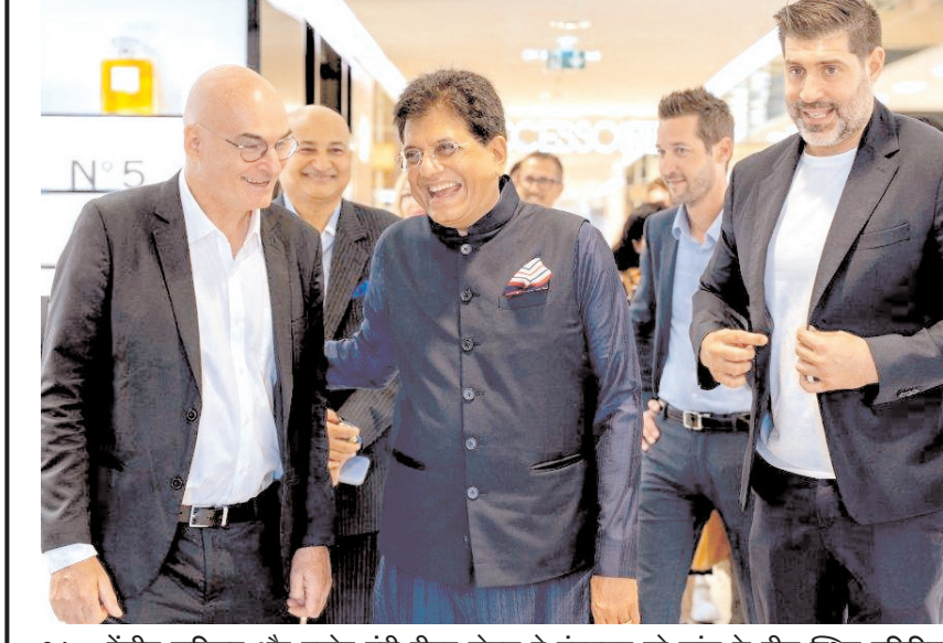
01- केंद्रीय वाणिज्य और उद्योग मंत्री पीयूष गोयल ने मंगलवार को फ्रांस के नीस स्थित प्रतिष्ठित 'मैलरीज लाकापेटे' में भारतीय डिजिटल भुगतान प्रणाली UPI को लांच किया। वैश्विक मंच पर भारत की यह एक और बड़ी उपलब्धि है।