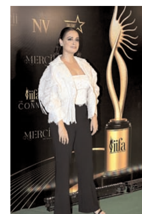
देते हुए कहा कि यह लंबे समय बाद देखी गई सबसे मार्मिक, प्रभावशाली और शक्तिशाली प्रेम कहानियों में से एक है। उन्होंने नसीरुद्दीन शाह के अभिनय की विशेष प्रशंसा की और कहा कि दिलजीत, वेदांग तथा शरवरी ने हर