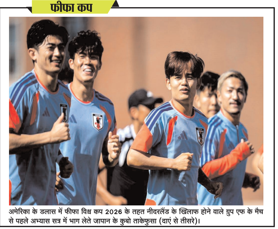
अमेरिका के डलास में फीफा विश्व कप 2026 के तहत नीदरलैंड के खिलाफ होने वाले ग्रुप एफ के मैच से पहले अभ्यास सत्र में भाग लेते जापान के कुबो ताकेफुसा (दाएं से तीसरे)।

लेते हैं। हमारे साथ संबंधित मंत्री हरदीप सिंह पुरी हैं। स्थिति सामने आने दीजिए।' उन्होंने पत्रकारों से प्रश्न किया कि क्या वे किसी निगरानी मंत्रालय की भूमिका निभा रहे हैं। पेट्रोल, डीजल और द्रवीकृत पेट्रोलियम गैस (एलपीजी) सहित ईंधन कीमतों में हाल के हफ्तों में वृद्धि हुई है। पश्चिम एशिया में जारी संघर्ष से कारण कच्चे तेल और प्राकृतिक गैस की आपूर्ति में बाधाओं के बाद यह वृद्धि हुई है।