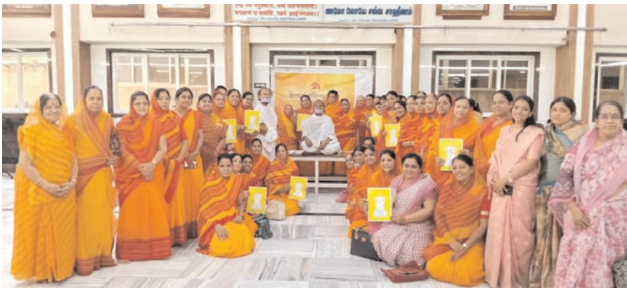
विश्व पर्यावरण दिवस पर प्रेरणादायी कार्यशाला का आयोजन