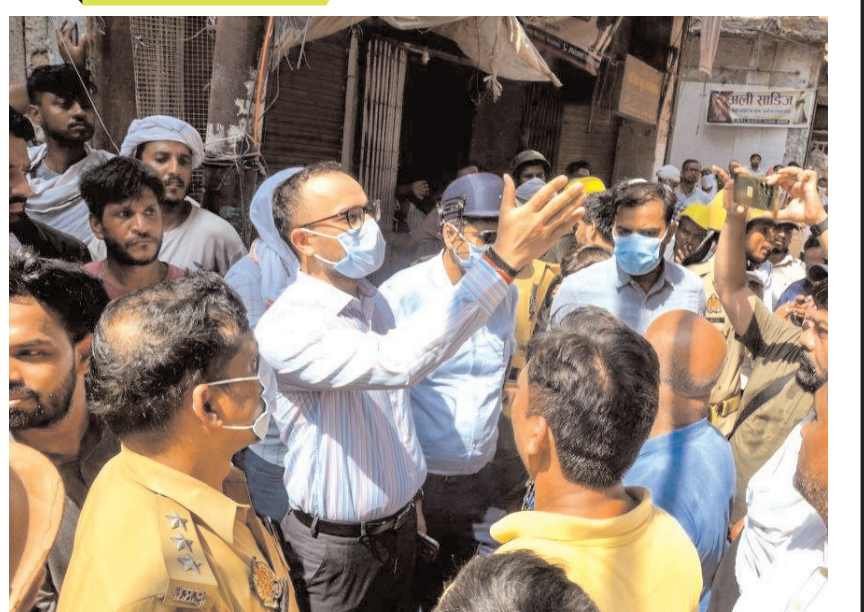
वारणसी में दालमंडी सड़क चौड़ीकरण परियोजना के तहत चल रहे ध्वस्तिकरण अभियान के दौरान स्थानीय निवासियों से बातचीत करते अधिकारी।