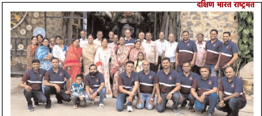
दक्षिण भारत राष्ट्रमत