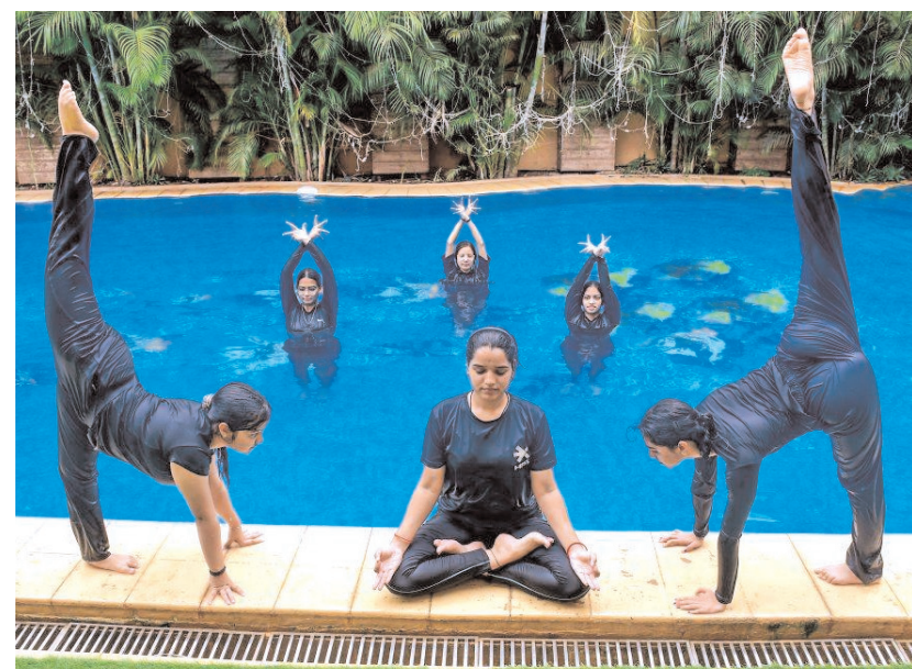
अंतरराष्ट्रीय योग दिवस की तैयारियों के मद्देनजर रविवार को जबलपुर में एक रिविनिंग पूल के भीतर योग का अभ्यास करते छात्र।