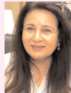
समझकर कुछ ऐसे फैसले लिए ताकि बच्चों को कभी भी बुरा महसूस न हो। उन्होंने कहा, मैंने अपने बच्चों के लिए कुछ समय तक

अभिनेत्री ने बातचीत में आगे बताया कि कैसे उन्होंने सोच-