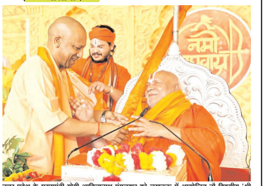
उत्तर प्रदेश के मुख्यमंत्री योगी आदित्यनाथ मंगलवार को लखनऊ में आयोजित नौ दिवसीय 'श्री राम कथा महोत्सव' के समापन कार्यक्रम के दौरान पद्म विभूषण जगद्गुरु रामभद्राचार्य जी से आशीर्वाद लेते हुए।