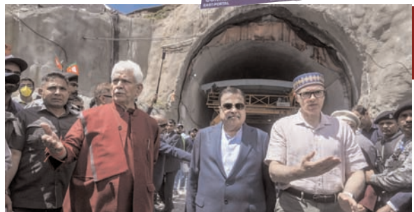
जोजिला सुरंग लद्दाख के लिए अहम बदलाव लाने वाली साबित होगी : उपराज्यपाल सक्सेना

सुरंग परियोजना फरवरी 2028 तक पूरा हो जाएगी। केंद्रीय मंत्री ने कहा, यह जम्मू-कश्मीर और लद्दाख के लोगों के लिए एक अनमोल तोहफा है। केंद्रीय सड़क परिवहन एवं राजमार्ग मंत्री ने परियोजना के इंजीनियरों और श्रमिकों को बधाई देते हुए कहा कि उन्होंने कड़क की ठंड व कठिन परिस्थितियों में काम किया है। उन्होंने कहा, इससे हर मौसम में आवागमन संभव हो सकेगा। सुरंग में सभी सुरक्षा सुविधाएं मौजूद हैं और इस परियोजना से स्थानीय लोगों को रोजगार मिला है। गडकरी ने बताया कि कुल लागत लगभग 7,000 करोड़ रुपए होने से 5,000 करोड़ रुपए की बचत हुई है, जो अनुमानित लागत 12,000 करोड़ रुपए से कम है।