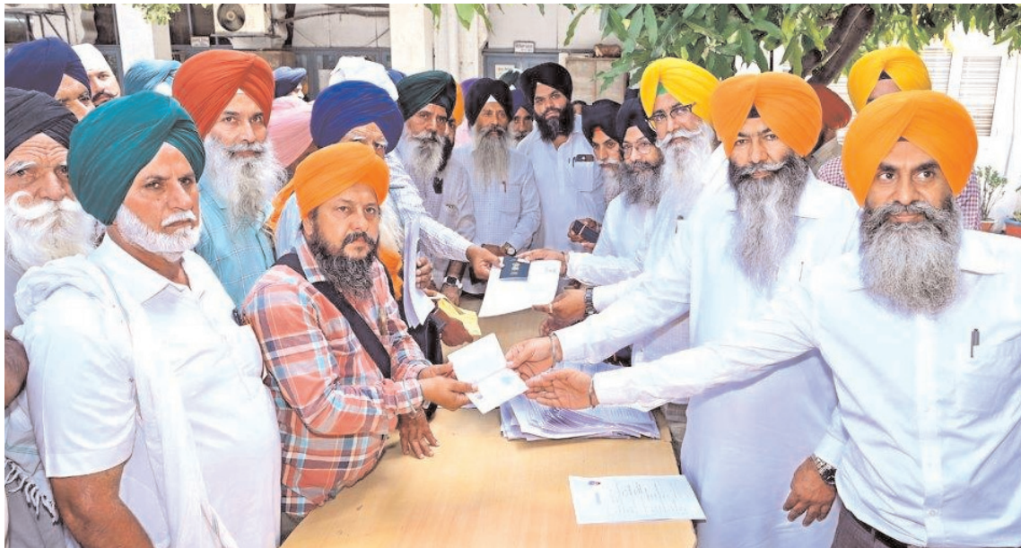
पांचवें सिख गुरु, गुरु अर्जुन देव जी के शहीदी दिवस के अवसर पर पाकिस्तान जाने से पहले मंगलवार को अमृतसर के स्वर्ण मंदिर (गोल्डन टेम्पल) परिसर में शिरोमणि गुरुद्वारा प्रबंधक कमेटी के अधिकारियों से अपने पासपोर्ट लेते सिख श्रद्धालु।