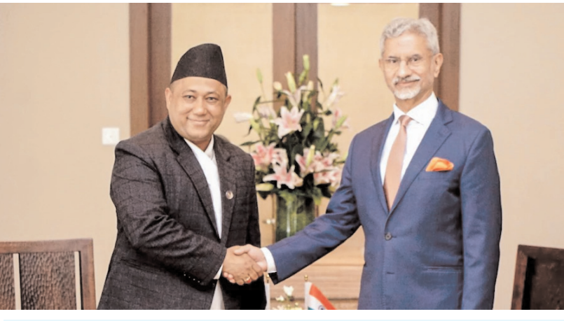
भारत के लिए यह दुर्भाग्यपूर्ण है कि भारतीय राजनीतिक नेतृत्व ने कभी भी चीन के लोकतांत्रिक मुद्दों में छिपी साम्राज्यवादी महत्वाकांक्षा को नहीं समझा? नतीजतन चीन की हड़प नीतियों के विरुद्ध न तो कभी दूता से खड़े हो पाए और न ही कड़ा रुख अपनाकर विश्व मंच पर अपना विरोध दर्ज करा पाए ?