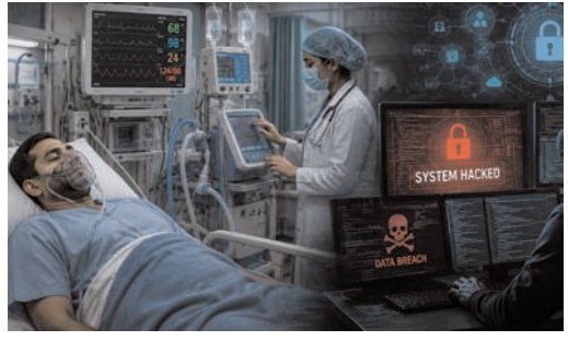
स्वास्थ्य संबंधी जानकारी अब केवल अस्पतालों के रिपोर्ट में नहीं, बल्कि करोड़ों लोगों के मोबाइल ऐप्स में भी सुरक्षित है। फिटनेस, शुगर मॉनिटरिंग, ब्लड प्रेशर और टेलीमेडिसिन ऐप्स व्यक्ति की बीमारी, दवाओं, पारिवारिक स्वास्थ्य इतिहास और कई बार अनुवंशिक जानकारी तक संजोते हैं। किंतु अनेक ऐप्स में सुरक्षा मानकों का पालन पर्याप्त नहीं होता। कमजोर पासवर्ड, अपर्याप्त एन्क्रिप्शन और समय पर अपडेट का अभाव उन्हें साइबर हमलों के प्रति संवेदनशील बनाता है। ऐसे में स्वास्थ्य डेटा अपराधियों के लिए बहुमूल्य संपत्ति बन जाता है, जिसका दुरुपयोग ब्लैकमेल से लेकर व्यावसायिक शोषण तक किया जा सकता है। जब स्वास्थ्य संबंधी गोपनीय सूचनाएँ लीक होती हैं, तब क्षति केवल डेटा तक सीमित नहीं रहती, बल्कि विश्वास की नींव भी हिल जाती है। बैंक खाते का पासवर्ड बदला जा सकता है, पर किसी व्यक्ति की बीमारी का इतिहास नहीं। यदि संवेदनशील स्वास्थ्य जानकारी सार्वजनिक हो जाए, तो उसका असर सामाजिक संबंधों, रोजगार के अवसरों और बीमा सुविधाओं तक पड़ सकता है। यही कारण है कि स्वास्थ्य क्षेत्र अन्य क्षेत्रों से भिन्न है। यहाँ डेटा का मूल्य केवल आर्थिक नहीं, बल्कि व्यक्ति की पहचान, प्रतिष्ठा और गरिमा से जुड़ा होता है। इसलिए स्वास्थ्य प्रणालियों की सुरक्षा का नुकसान केवल संस्थानों तक सीमित नहीं रहता, बल्कि पूरे समाज को प्रभावित करता है।

संकट की गहराई केवल डेटा चोरी तक सीमित नहीं है। आज साइबर हमले सीधे जीवनरक्षक चिकित्सा उपकरणों तक पहुँच सकते हैं। यदि किसी इंसुलिन पंप की डोज या वेंटिलेटर की सेटिंग से छेड़छाड़ हो जाए, तो परिणाम गंभीर हो सकते हैं। यह मात्र काल्पनिक आशंका नहीं, बल्कि वैश्विक अध्ययनों और चेतनाविनियों का विषय है। रैसमवेयर हमलों के दौरान ऑपरेशन थिएटर प्रभावित होते हैं, आपातकालीन सेवाएँ बाधित होती हैं और उपचार व्यवस्था संकट में पड़ जाती है। डिजिटल चिकित्सा की नींव