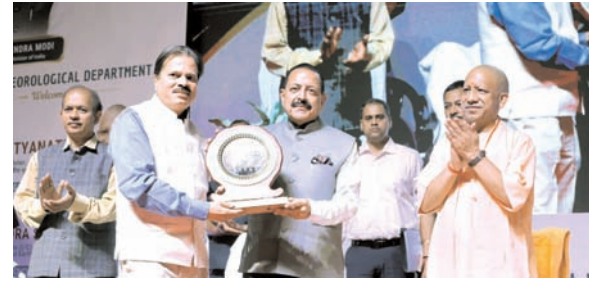
क्षमताएं काफी मजबूत होंगी।

साथ यहां नए क्षेत्रीय मौसम केंद्र (आरएमसी) का उद्घाटन किया। उन्होंने कहा कि 2014 में भारत में केवल '17 डॉक्टर मौसम रडार' थे, जबकि जम्मू-कश्मीर, पंजाब और उत्तराखंड सहित कई राज्यों में एक भी रडार नहीं था। उन्होंने बताया कि अब यह नेटवर्क बढ़कर 50 डॉक्टर मौसम रडार तक पहुंच गया है तथा 'मिशन मौसम' के तहत 50 और रडार लगाने का प्रस्ताव है, जिससे अगले दो वर्षों में कुल रडार की संख्या लगभग 100 हो जाएगी। उन्होंने कहा कि इस विस्तार से पूरे देश में वास्तविक समय (रियल-टाइम) में मौसम की निगरानी और पूर्वानुमान की