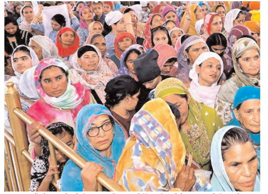
अमृतसर में सोमवार को छठे सिख गुरु, श्री गुरु हरगोविंद साहिब जी के 'गुरुता गद्दी दिवस' के पान अवसर पर अमृतसर के स्वर्ण मंदिर (हरमंदिर साहिब) में माथा टेकने और दर्शन करने पहुंचे श्रद्धालु।