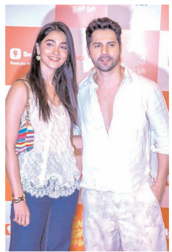
मुंबई में अपनी आगामी फिल्म 'हाय जवानी तो इश्क होना है' के प्रमोशन के दौरान मीडिया कैमरों के लिए पोज देते बॉलीवुड कलाकार वरुण धवन और पूजा हेगड़े।

उन्होंने आगे कहा, 'मैं बचपन से ही अपनी उम्र के बच्चों की तुलना में ज्यादा समझदार थी। जहां अधिकतर बच्चे अपनी इच्छाओं और जरूरतों के बारे में सोचते हैं, वहीं मैं अपने परिवार की परिस्थितियों और माता-पिता की भावनाओं को समझने लगी थी।