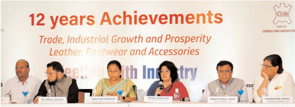
दक्षिण भारत राष्ट्रमत dakshinbharat.com