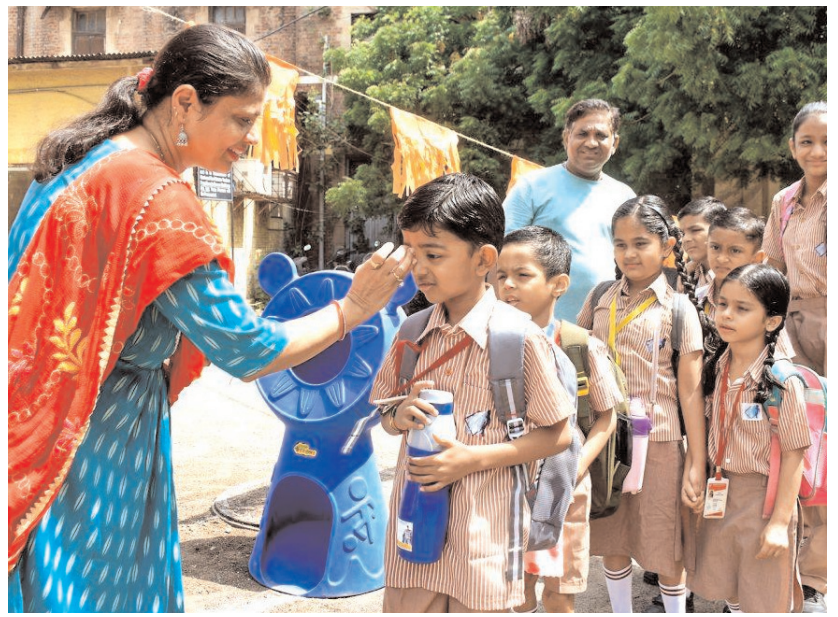
वडोवरा, गुजरात में सोमवार को गर्मियों की छुट्टियां खत्म होने के बाद स्कूल लौटे छात्रों का तिलक लगाकर स्वागत करती एक शिक्षिका।