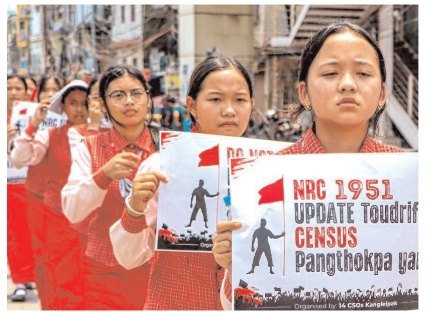
मणिपुर में सोमवार को विभिन्न नागरिक संगठनों और '14 उडडी कागलेड्पाक' के बैनर तले पहले छठ, बाद में जनगणना रैली में शामिल होते छात्र।