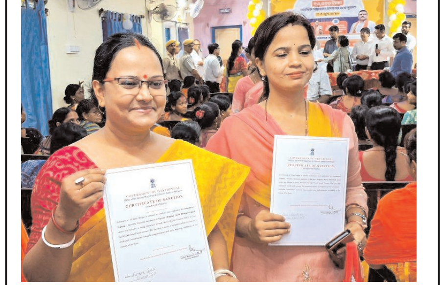
पश्चिम मेदिनीपुर के मेदिनीपुर सदर ब्लॉक कार्यालय में बुधवार को 'अन्नपूर्णा भंडार योजना' के तहत महिला लाभार्थियों को वित्तीय सहायता राशि प्रदान की गई। इस योजना के अंतर्गत महिलाओं को प्रति माह 3,000 की सहायता दी जाती है।