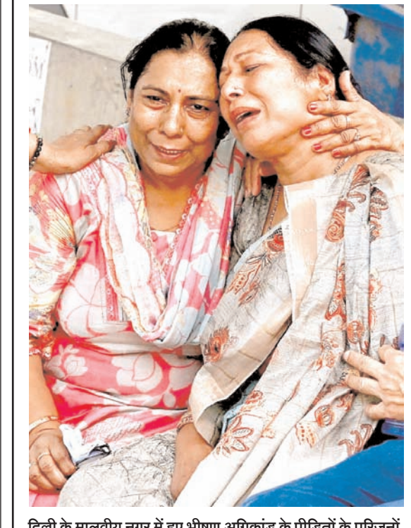
दिल्ली के मालवीय नगर में हुए भीषण अग्निकांड के पीड़ितों के परिजनों का मेक्स अस्पताल के बाहर रो-रोकर बुरा हाल है। बुधवार को हुए इस दर्दनाक हादसे में कथित तौर पर 21 लोगों की जान चली गई और कई अन्य गंभीर रूप से घायल हो गए।