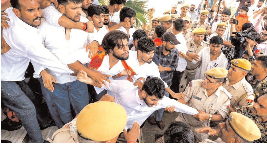
राजस्थान विश्वविद्यालय में अपनी विभिन्न मांगों को लेकर प्रदर्शन कर रहे अखिल भारतीय विद्यार्थी परिषद के कार्यकर्ताओं और पुलिसकर्मीयों के बीच बुधवार को तीखी झड़प हुई।