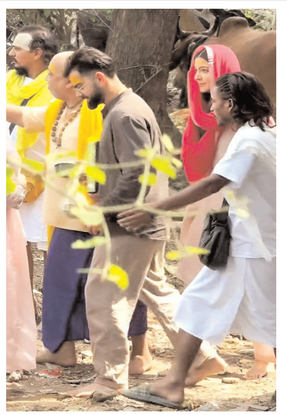
उत्तर प्रदेश के मथुरा जिले के वृंदावन में मंगलवार को आध्यात्मिक गुरु प्रेमानंद महाराज के आश्रम में दर्शन के लिए पहुंचे क्रिकेट विराट कोहली और उनकी पत्नी व अभिनेत्री अनुष्का शर्मा।