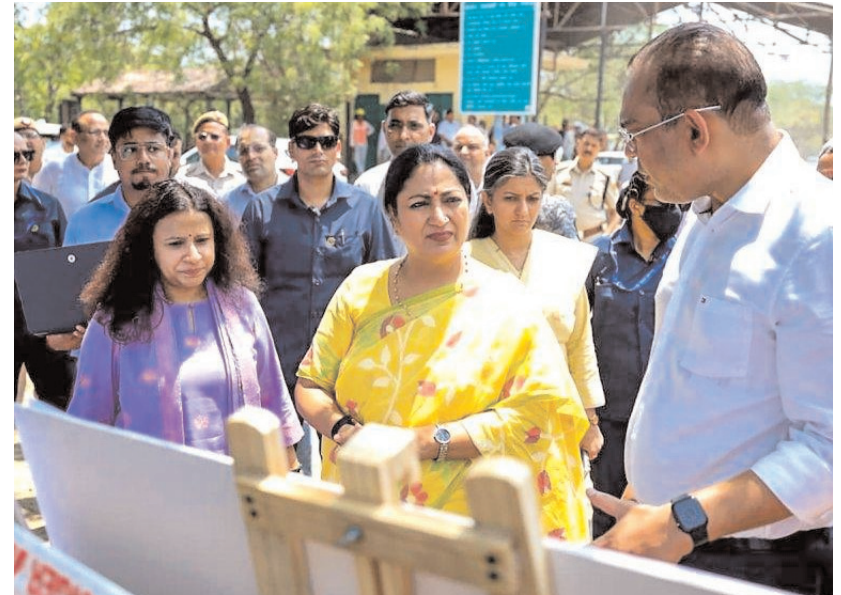
दिल्ली की मुख्यमंत्री रेखा गुप्ता मंगलवार को नई दिल्ली के बुराड़ी में औचक निरीक्षण के दौरान जिला परिवहन कार्यालय, वाहन निरीक्षण इकाई, वाहन प्रशिक्षण संस्थान और रचवाचित परीक्षण स्टेशन का जायजा लेती हुई।