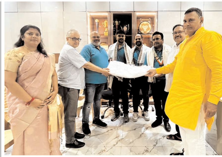
- राजस्थान कॉस्मो क्लब फाउंडेशन की सरहनीय पहल-

उन्होंने कहा कि जहां राग-द्वेष और मोह का क्षय होता है, वहीं मोक्ष के प्रति रुचि जागृत होती है। जिस वस्तु या विषय के प्रति मोह हो, उसका त्याग ही आत्मकल्याण का मार्ग है।