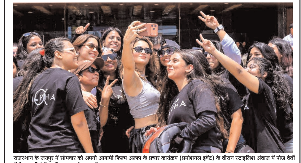
राजस्थान के जयपुर में सोमवार को अपनी आगामी फिल्म अल्का के प्रचार कार्यक्रम (प्रमोशनल इवेंट) के दौरान स्टायलिश अंदाज में पोज देती बॉलीवुड अभिनेत्री आलिया भट्ट और शरवरी।