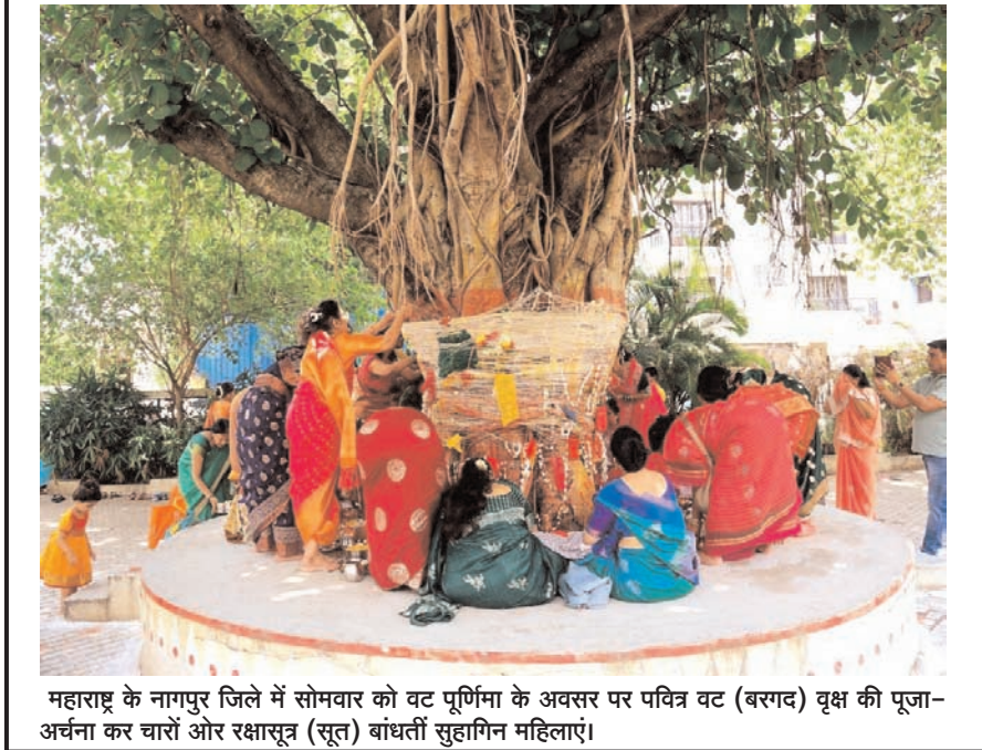
महाराष्ट्र के नागपुर जिले में सोमवार को वट पूर्णिमा के अवसर पर पवित्र वट (बरगद) वृक्ष की पूजा-अर्चना कर चारों ओर रक्षासूत्र (सूत) बांधती सुहागिन महिलाएं।