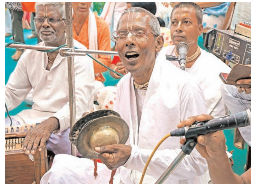
पश्चिम बंगाल के बीरभूम जिले के मकरमपुर स्थित गौड़ीय मठ में सोमवार को महा स्नान पूर्णिमा उत्सव के दौरान भजन-कीर्तन करते श्रद्धालु।