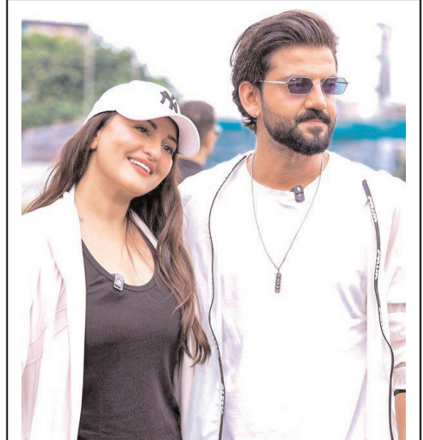
सोमवार को मुंबई (महाराष्ट्र) के एक पैडल कोर्ट में अपने पति व अभिनेता जहिर इकबाल रतनसी के साथ फुसंत के पल बिताती बॉलीवुड अभिनेत्री सोनाक्षी सिन्हा।

आवाजाही रुक गई। सामान्य समय में दुनिया भर में व्यापार होने वाले तेल और प्राकृतिक गैस का लगभग पांचवां हिस्सा इसी रास्ते से गुजरता था, जिससे वैश्विक ऊर्जा संकट पैदा हो गया। भले ही यह जलडमरूमध्य ईरान और ओमान के समुद्री क्षेत्र में स्थित है, फिर भी इसे लंबे समय से एक अंतरराष्ट्रीय जलमार्ग माना जाता रहा है। हाल के दिनों में, ईरान ने ओमान की तरफ वाले रास्ते से गुजरने वाले जहाजों पर दो बार हमले किए हैं। इसके जवाब में अमेरिकी ने हवाई हमले किए हैं और ऐसी चिंताएं भी पैदा हो गई हैं कि युद्ध को औपचारिक रूप से खत्म करने के लिए चल रही बातचीत में रुकावट आ सकती है।