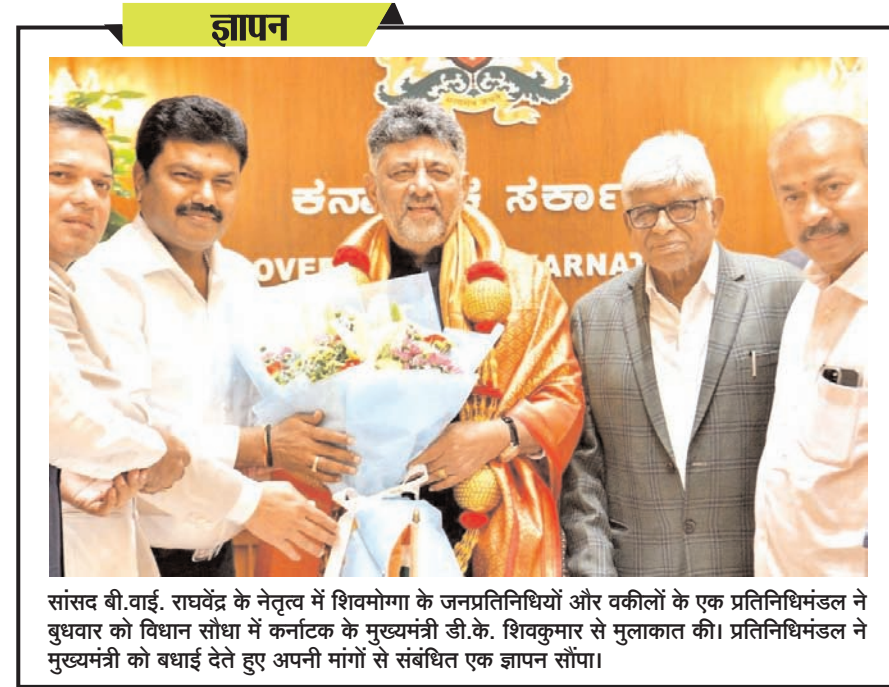
सांसद बी.वी. राघवेंद्र के नेतृत्व में शिवमोगा के जनप्रतिनिधियों और वकीलों के एक प्रतिनिधिमंडल ने बुधवार को विधान सौंधा में कर्नाटक के मुख्यमंत्री डी.के. शिवकुमार से मुलाकात की। प्रतिनिधिमंडल ने मुख्यमंत्री को बधाई देते हुए अपनी मांगों से संबंधित एक ज्ञापन सौंपा।

गिरफ्तार किया गया था। दोनों पर आरोप है कि वे सोशल मीडिया के जरिए पाकिस्तान में रहने वाले एक व्यक्ति के संपर्क में थे और भारत की राष्ट्रीय सुरक्षा के खिलाफ गतिविधियों की साजिश रच रहे थे। गिरफ्तारी की पुष्टि करते हुए कर्नाटक के गृह मंत्री प्रियंक खरगे ने कहा कि उत्तर प्रदेश से रहने वाले जिस व्यक्ति को गिरफ्तार किया गया है, वह कुछ पाकिस्तानियों के संपर्क में था। उन्होंने कहा कि मामले की जांच पूरी होने के बाद ही और जानकारी सामने आएगी। उन्होंने बंगलूर में पत्रकारों से कहा, 'प्रारंभिक जांच और उपलब्ध जानकारी के अनुसार, उत्तर प्रदेश का वह व्यक्ति काम की तलाश में यहां आया था। उसके मोबाइल फोन से कुछ जानकारी मिली है। इसलिए उसे गिरफ्तार कर लिया गया है।' खरगे ने कहा, 'व्हाट्सएप पर बातचीत से पता चला है कि वह कुछ पाकिस्तानियों के संपर्क में था। लेकिन क्या बड़े पैमाने पर कडरपंथ की ओर आकर्षित किया गया या कुछ और हुआ, यह जांच पूरी होने के बाद ही पता चलेगा। फिलहाल वह हिरासत में है।'