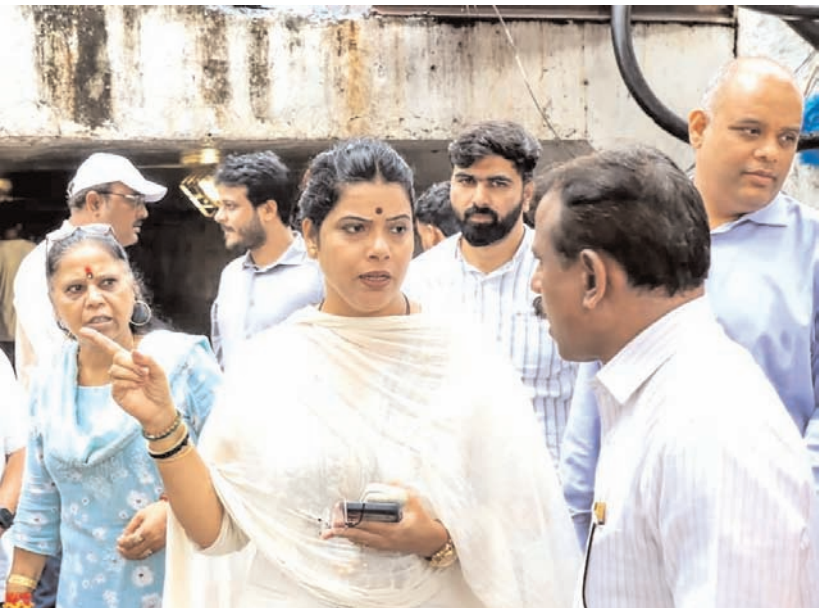
मुंबई में हुई बारिश के बाद, मुंबई की मेयर रितु तावडे ने बुधवार को मानसून की तैयारियों और जलभराव से निपटने के उपायों की समीक्षा की।