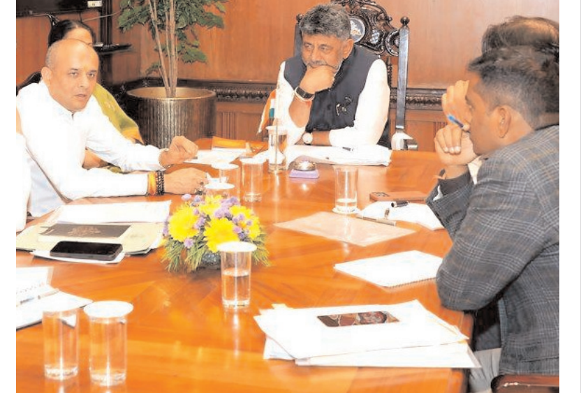
कर्नाटक के मुख्यमंत्री डी.के. शिवकुमार ने बुधवार को बंगलूर के विधान सौंधा में वित्त विभाग के वरिष्ठ अधिकारियों के साथ एक अहम बैठक की अध्यक्षता की और राज्य के वित्तीय मामलों की समीक्षा की।