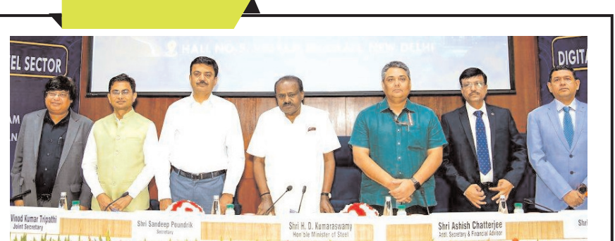
केंद्रीय इस्पात मंत्री एच.डी. कुमारस्वामी बुधवार को नई दिल्ली में आयोजित 'चिंतन शिविर 2026' में शामिल हुए। इस शिविर का मुख्य उद्देश्य इस्पात क्षेत्र में डिजिटलाइजेशन और आधुनिक तकनीकों को बढ़ावा देना था।

याग्निक ने कहा, 'यह पल खास तौर पर मायने रखता है क्योंकि यह न सिर्फ मेरे काम को मिली पहचान का प्रतीक है, बल्कि उस ताकत की याद भी दिलाता है जो प्यार, उम्मीद और मुश्किलों से उबरने की क्षमता से मिलती है... मैं धीरे-धीरे वापसी कर रही हूँ।' उन्होंने इस सम्मान के लिए राष्ट्रपति द्रौपदी मुर्मू और प्रधानमंत्री नरेन्द्र मोदी का धन्यवाद करते हुए कहा कि वह वहां सिर्फ अपने लिए नहीं, बल्कि उन सभी लोगों के लिए मौजूद रहना चाहती थीं जो उनकी यात्रा का हिस्सा रहे हैं। याग्निक ने लिखा, 'इतने सालों तक आपके स्नेह, दया, प्रार्थनाओं और मुझ पर भरोसे के लिए आपका धन्यवाद। मैं इन सभी को अपने साथ संजोकर रखती हूँ।'