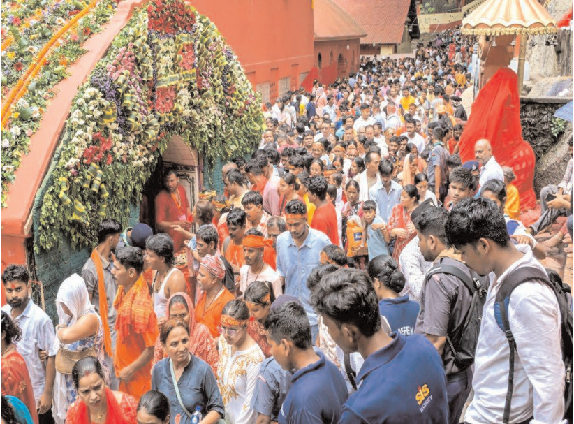
प्रसिद्ध अंबुबाची मेले के अवसर पर बुधवार को गुवाहाटी की नीलाचल पहाड़ी पर स्थित कामाख्या मंदिर में दर्शन के लिए देश भर से आए श्रद्धालुओं की भारी भीड़ उमड़ी।