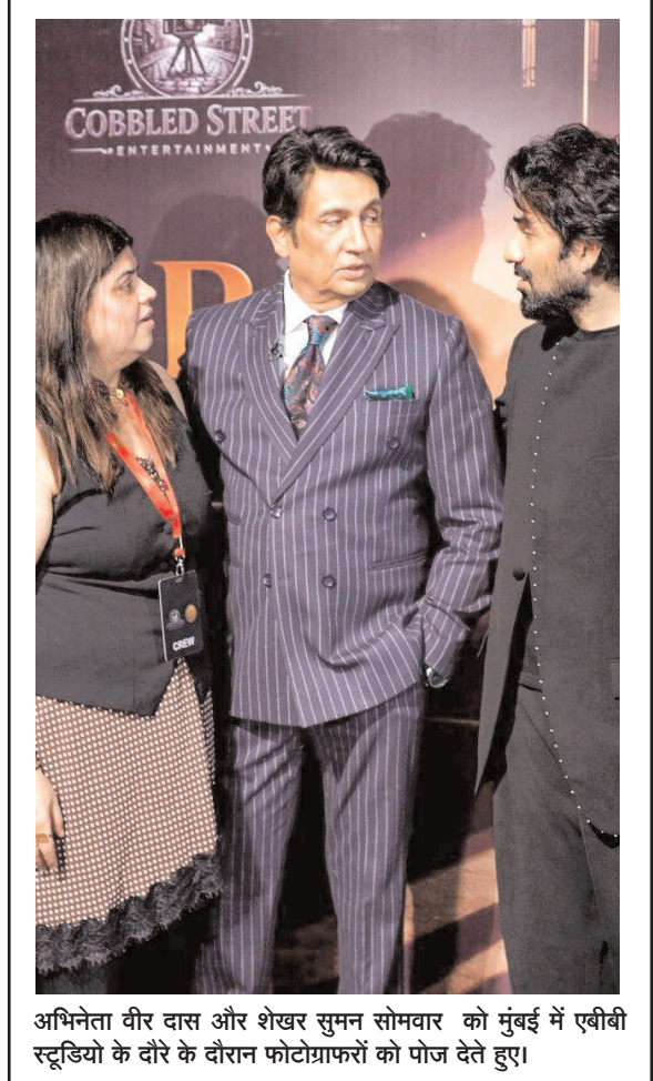
अभिनेता वीर दास और शेखर सुभन सोमवार को मुंबई में एबीवी रूडियो के दौरे के दौरान फोटोग्राफों को पोज देते हुए।

फिलहाल सोशल मीडिया पर एटली द्वारा साझा की गई तस्वीर में दोनों एक-दूसरे के साथ बेहद सहज और खुश नजर आ रहे हैं। तस्वीर में एटली, विजय को गर्मजोशी से गले लगाए हुए हैं और दोनों मुस्कुराते दिखाई दे रहे हैं। यह पोस्ट केवल जन्मदिन की शुभकामना नहीं, बल्कि उनके बीच के गहरे सम्मान, दोस्ती और भाईचारे का भी खूबसूरत प्रतीक बनकर सामने आई है।