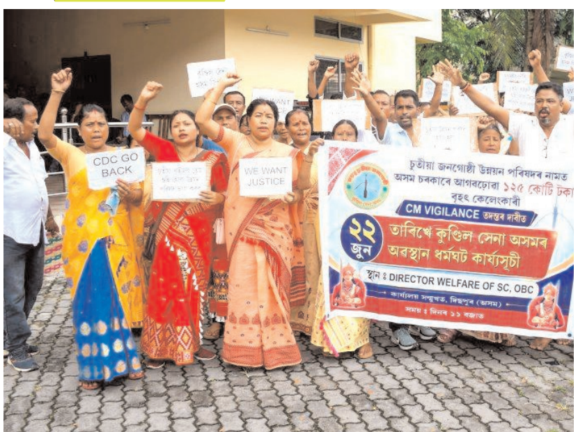
गुवाहाटी में सोमवार को गुवाहाटी में कुंडिल सेना असम के सदस्यों ने विकास परिषद को असम सरकार द्वारा आवंटित धन की मुख्यमंत्री सतकर्ता जांच की मांग को लेकर विरोध प्रदर्शन किया।