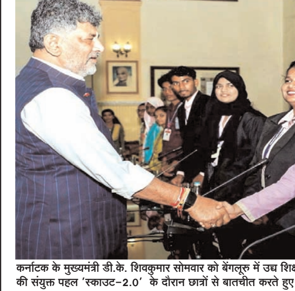
कर्नाटक के मुख्यमंत्री डी.के. शिवकुमार सोमवार को बंगलूरु में उच्च शिक्षा विभाग और ब्रिटिश काउंसिल की संयुक्त पहल 'स्काउट-2.0' के दौरान छात्रों से बातचीत करते हुए।