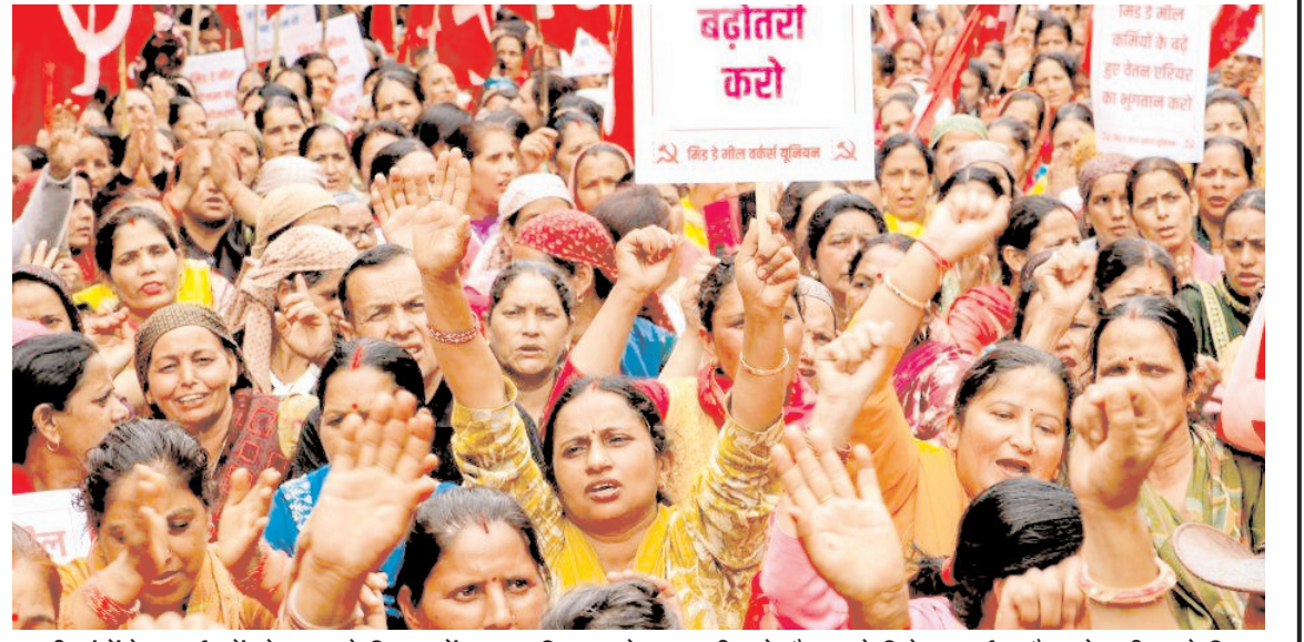
अपनी मांगों के समर्थन में सोमवार को शिमला में राज्य सचिवालय के बाहर सीटू के बेनर तले विरोध प्रदर्शन और नारेबाजी करते मिड-डे मील कार्यकर्ता।