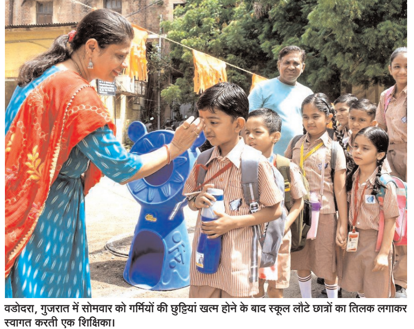
वडोदरा, गुजरात में सोमवार को गर्मियों की छुट्टियां खत्म होने के बाद स्कूल लौटे छात्रों का तिलक लगाकर स्वागत करती एक शिक्षिका।