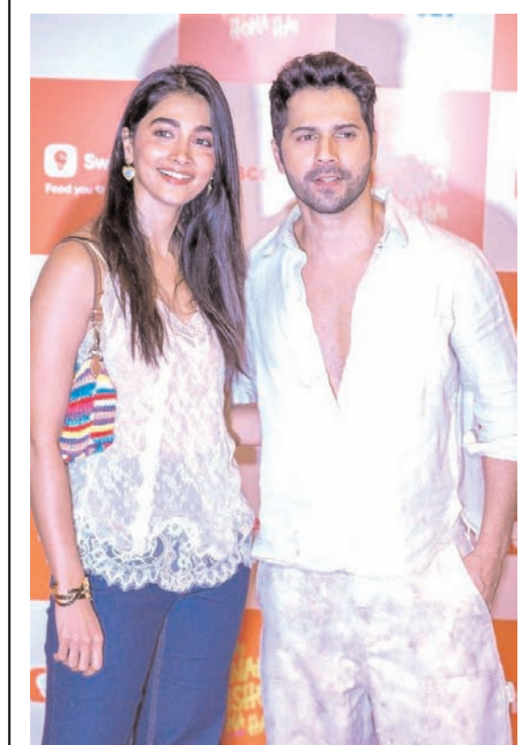
मुंबई में अपनी आगामी फिल्म 'हाय जवानी तो इश्क होना है' के प्रमोशन के दौरान मीडिया कैमरों के लिए पोज देते बॉलीवुड कलाकार वरुण धवन और पूजा हेगड़े।

उन्होंने आगे कहा, 'मैं बचपन से ही अपनी उम्र के बच्चों की तुलना में ज्यादा समझदार थी। जहां अधिकतर बच्चे अपनी इच्छाओं और जरूरतों के बारे में सोचते हैं, वहीं मैं अपने परिवार की परिस्थितियों और माता-पिता की भावनाओं को समझने लगी थी।