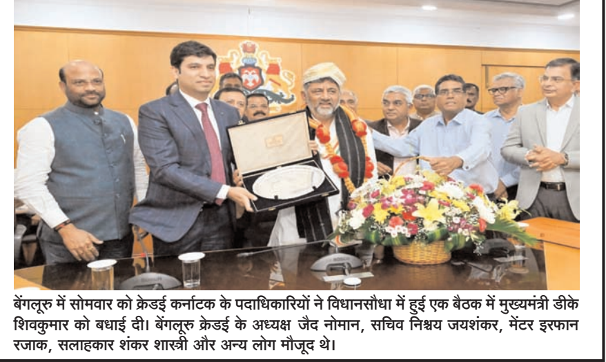
बंगलूरु में सोमवार को क्रेडिट कर्नाटक के पदाधिकारियों ने विधानसभा में हुई एक बैठक में मुख्यमंत्री डीके शिवकुमार को बधाई दी। बंगलूरु क्रेडिट के अध्यक्ष जैद नोमान, सचिव निश्चय जयशंकर, मंटर इफ्रान रजाक, सलाहकार शंकर शास्त्री और अन्य लोग मौजूद थे।