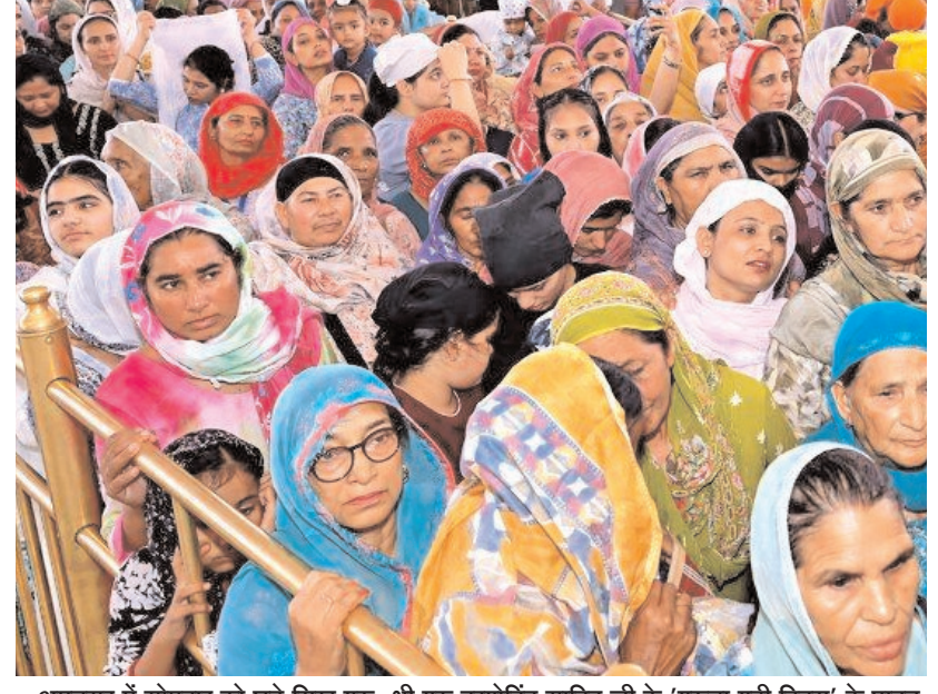
-अमृतसर में सोमवार को छोटे सिख गुरु, श्री गुरु हरगोविंद साहिब जी के 'गुरुता गद्दी दिवस' के पानन अवसर पर अमृतसर के स्वर्ण मंदिर (हरमंदिर साहिब) में माथा टेकने और दर्शन करने पहुंचे श्रद्धालु।