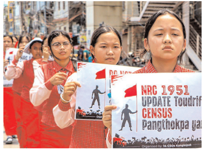
मणिपुर में सोमवार को विभिन्न नागरिक संगठनों और '14 उडकी कागलेड्पाक' के बैनर तले पहले छठ, बाद में जनगणना रैली में शामिल होते छात्र।