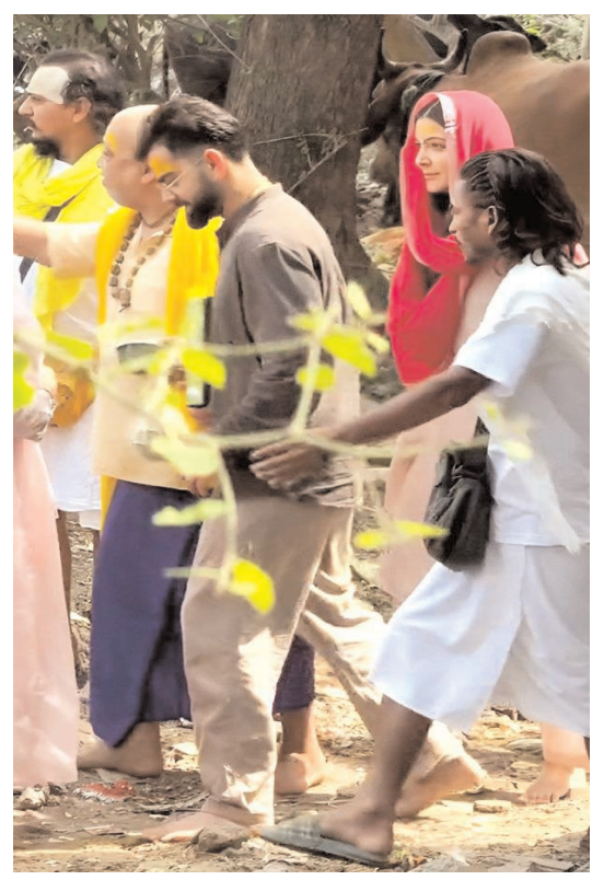
उत्तर प्रदेश के मथुरा जिले के वृंदावन में मंगलवार को आध्यात्मिक गुरु प्रेमानंद महाराज के आश्रम में दर्शन के लिए पहुंचे क्रिकेट विराट कोहली और उनकी पत्नी व अभिनेत्री अनुष्का शर्मा।