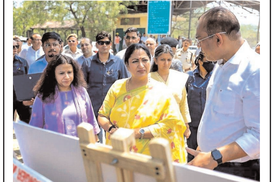
दिल्ली की मुख्यमंत्री रेखा गुप्ता मंगलवार को नई दिल्ली के बुराड़ी में औचक निरीक्षण के दौरान जिला परिवहन कार्यालय, वाहन निरीक्षण इकाई, वाहन प्रशिक्षण संस्थान और रचवाचित परीक्षण स्टेशन का जायजा लेती हुई।