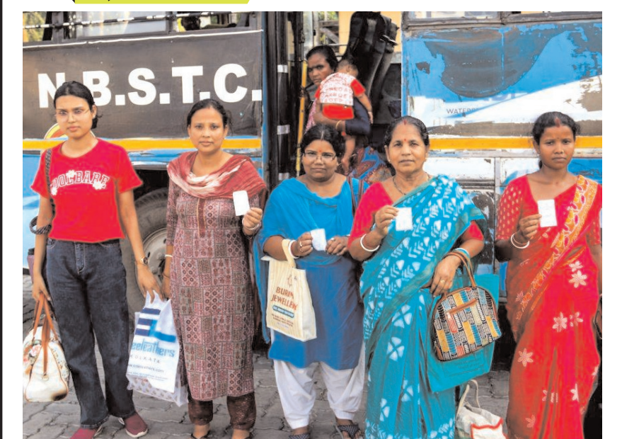
पश्चिम बंगाल के दक्षिण दिनाजपुर जिले के बालुरघाट में सोमवार को महिलाओं के लिए राज्य भर में फ्री बस यात्रा योजना लागू होने के बाद महिला यात्री अपने टिकट दिखाती हुई।