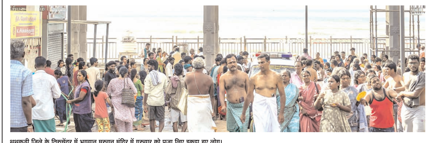
थूथुकुडी जिले के तिरुचेंदूर में भगवान मुरुगन मंदिर में गुरुवार को पूजा लिए इकट्ठा हुए लोग।

समझ नहीं आता कि आपके साथ कैसे पेश आए। रिद्धि ने पोस्ट के अंत में लिखा, ऐसा नहीं है कि जिंदगी ने आपको अकेलापन नहीं दिया, बल्कि आपने उस अकेलेपन को अपना दोस्त बना लिया। उसके साथ वक्त बिताना और उसे अपनी छोटी-सी खुबसूरत कहानी बना लिया रिद्धि डोगरा की इस पोस्ट को उनके फैंस काफी पसंद कर रहे हैं। लोग कमेंट्स में तरह-तरह की प्रतिक्रियाएं दे रहे हैं। रिद्धि डोगरा कई लोकप्रिय रियलिटी शो में भी हिस्सा ले चुकी हैं। वह अपने तत्कालीन पति राकेश बापट के साथ डॉस रियलिटी शो नच बलिए 6 (2013-14) और स्टंट आधारित शो फियर फैक्टर: खतरों के खिलाड़ी 6 (2015) में नजर आ चुकी हैं। हाल ही में वह द 50 में भी दिखाई दी थीं। यह शो कलर्स टीवी और जियोसिनेमा पर प्रसारित हुआ था।