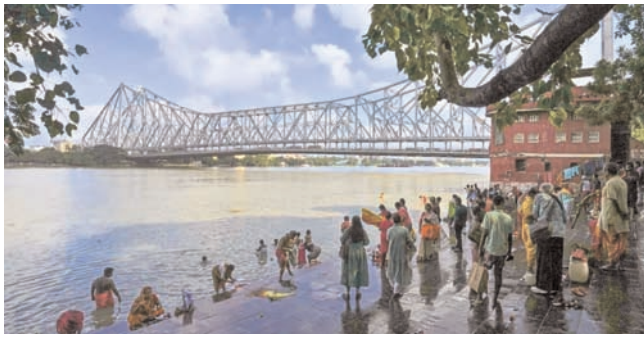
दक्षिण भारत राष्ट्रमत dakshinbharat.com

नई दिल्ली/भाषा। गंगा नदी के समुद्र में गिरने से पहले उसके मुख्य प्रवाह मार्ग के अंतिम राज्य पश्चिम बंगाल में पिछली राज्यों से अपशिष्ट और औद्योगिक भार बढ़ने के बाद भी उसके प्रदूषण के स्तर में उल्लेखनीय सुधार हुआ है। नमामि गंगे परियोजना में यह दावा किया गया है। स्वच्छ गंगा राष्ट्रीय मिशन (एनएमजीसी) ने 'एक्स' पोस्ट में कहा कि पश्चिम बंगाल में नदी का अंतिम भाग हिमालय से घनी