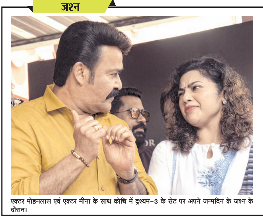
एक्टर मोहनलाल एवं एक्टर मीना के साथ कोवि में दृश्यम-3 के सेट पर अपने जन्मदिन के जश्न के दौरान।