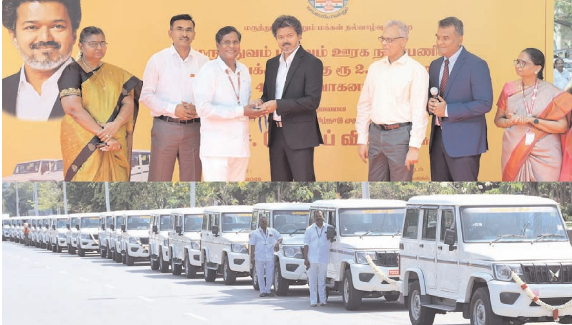
1997 का कड़ाई से अनुपालन सुनिश्चित किया जा सके। विज्ञप्ति में कहा गया है कि इन वाहनों को अल्ट्रासाउंड स्कैन केन्द्रों का निरीक्षण करने, झोलाछाप चिकित्सकों के खिलाफ जांच में तेजी लाने, रोगी देखभाल मानकों की निगरानी करने और आपदाओं तथा महामारियों के दौरान आपात राहत अभियानों का प्रबंधन करने के लिए भी तैनात किया जाएगा।

यहां जारी एक प्रेस विज्ञप्ति के अनुसार, बेड़े में शामिल नए वाहनों को सरकारी और निजी अस्पतालों की निगरानी का काम सौंपा गया है ताकि गर्भाधान-पूर्व एवं प्रसव-पूर्व निदान तकनीक (पीसीपीएनडीटी) अधिनियम, 1994 तथा तमिलनाडु नैदानिक प्रतिष्ठान (विनियमन) अधिनियम,