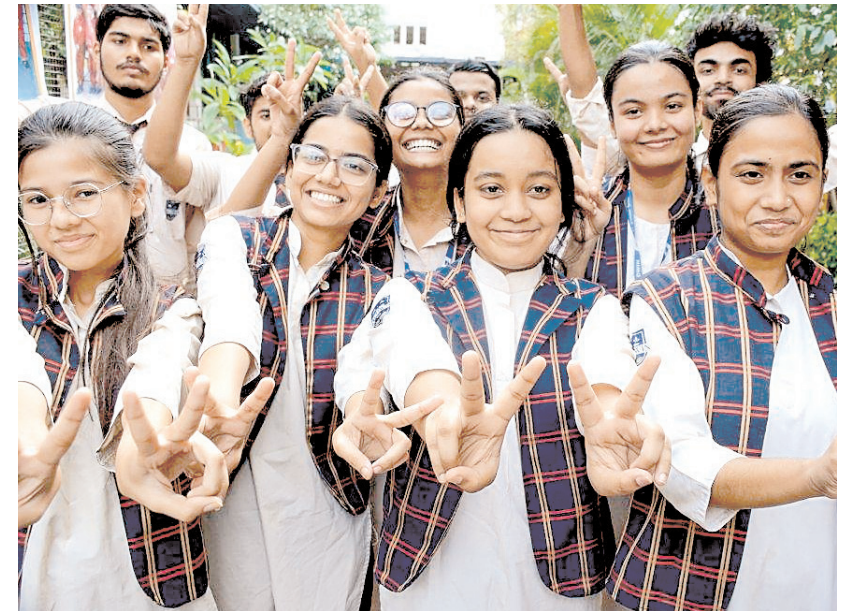
बिहार के पटना जिले में सीबीएसई क्लास 12 के परीक्षा परिणाम घोषित होने के बाद छात्र जश्न मनाते हुए।