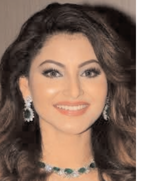
परफेक्ट दिखने की सोच को छोड़ना बहुत जरूरी होता है। उन्होंने कहा, लोग अक्सर मुझसे हर फ्रेम, हर एक्सप्रेशन और हर पल

बॉलीवुड अभिनेत्री उर्वशी रौतेला एक बार फिर वेब सीरीज 'इंस्पेक्टर अविनाश' के नए सीजन में पूनम मिश्रा के किरदार में नजर आने वाली हैं। इस बीच उर्वशी ने अपने किरदार और एक्टिंग को लेकर बात की। उन्होंने कहा कि उनकी पब्लिक इमेज हमेशा ग्लैमर से जुड़ी रही है, लेकिन 'इंस्पेक्टर अविनाश' जैसे प्रोजेक्ट्स में दिखावे से ज्यादा सच्ची भावनाओं की जरूरत होती है। उर्वशी ने आईएनएस से बताया कि एक कलाकार के तौर पर आगे बढ़ने के लिए 'परफॉर्मिंग वैनिटी' यानी