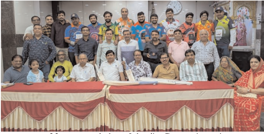
शाकद्वीपीय ब्राह्मण युवा स्पोर्ट्स क्लब की बैठक में उपस्थित युवा एवं समाज बंधु।