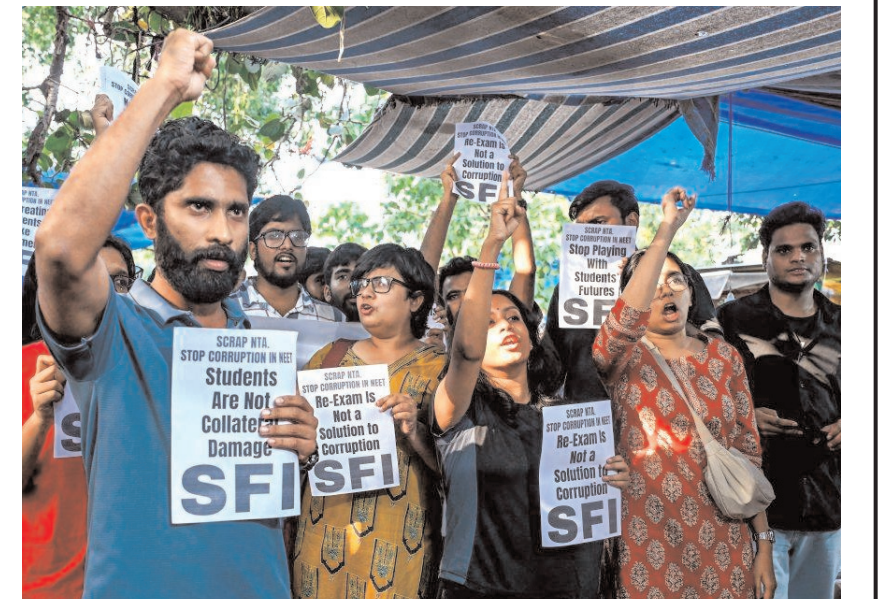
नई दिल्ली में स्टूडेंट्स फेडरेशन ऑफ इंडिया के सदस्य और समर्थक मंगलवार को नई दिल्ली में कथित नीट-यूजी पेपर लीक के खिलाफ विरोध प्रदर्शन करते हुए।