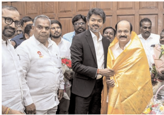
उन्होंने जनता, विशेषकर युवाओं के कल्याण और प्रशासन में पारदर्शिता के प्रति अपनी सरकार की प्राथमिकताओं को रेखांकित किया। इसके अलावा, उन्होंने