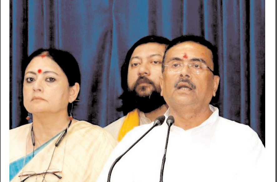
पश्चिम बंगाल के मुख्यमंत्री सुवेदु अधिकारी सोमवार को हावड़ा के नवब्राम में कैबिनेट मीटिंग के बाद दूसरे मंत्रियों के साथ मीडिया को संबोधित करते हुए।