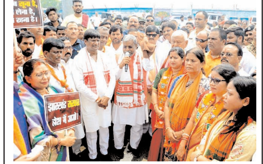
झारखंड विधानसभा में विपक्ष के नेता और भाजपा विधायक बाबूलाल मरांडी सोमवार को झारखंड के धनबाद जिले में पानी और बिजली की समस्याओं को लेकर जिला कलेक्टर ऑफिस के बाहर विरोध प्रदर्शन को संबोधित करते हुए।