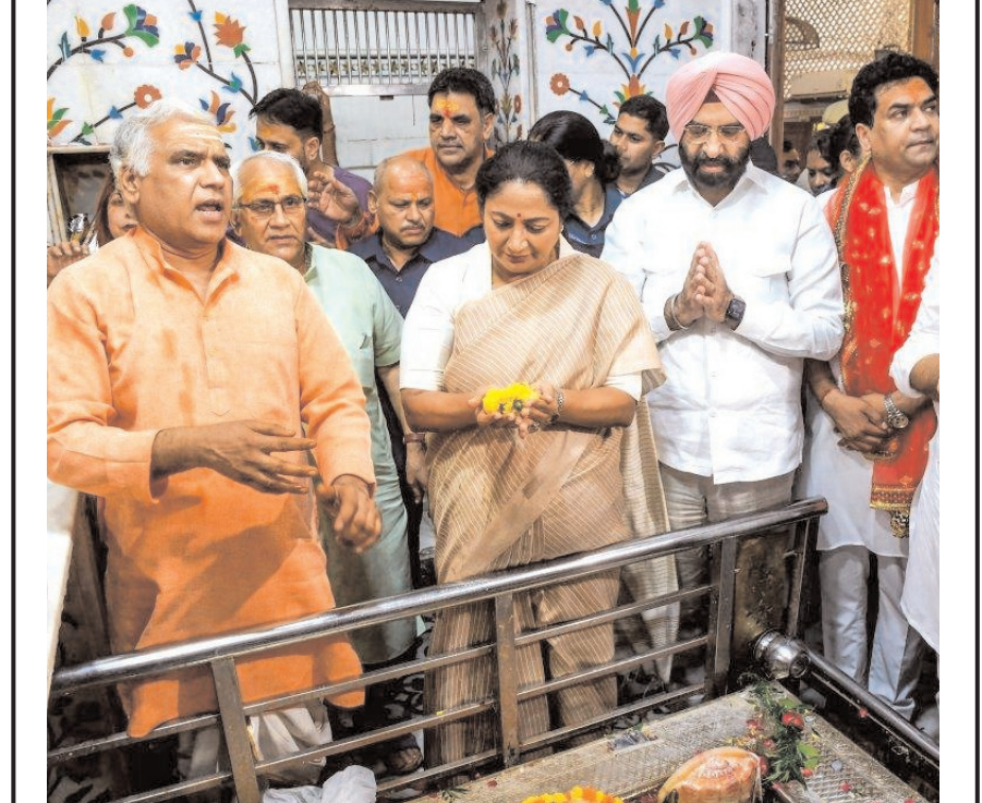
नई दिल्ली में सोमनाथ स्वाभिमान पर्व के मोके पर दिल्ली की मुख्यमंत्री रेखा गुप्ता, कैबिनेट मंत्री कपिल मिश्रा, मनजिंदर सिंह विरसा और प्रवेश वर्मा के साथ गौरी शंकर मंदिर में पूजा-अर्चना करते हुए।