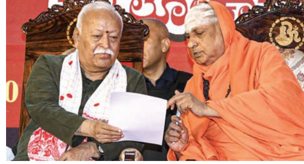
प्राप्त करना होता है। यदि उन्हें काम के आधार पर वोट नहीं मिलते, तो वे जाति के आधार पर वोट हासिल करेंगे।" जनसंख्या नियंत्रण विधेयक और समान नागरिक संहिता से जुड़े एक संवाद के जवाब में भागवत ने कहा कि आरएसएस सरकार नहीं, बल्कि एक सामाजिक संगठन है। उन्होंने यह भी कहा कि कोई भी कानून तभी सफल हो सकता है जब उसे जनता का सहयोग मिले। उन्होंने कहा, "पहले लोगों को शिक्षित करना जरूरी है। नीति आवश्यक है, लेकिन नीति तभी सफल होगी जब जनता का सहयोग मिलेगा।" आपातकाल के दौरान

दक्षिण भारत राष्ट्रमत dakshinbharat.com मैसूरु (कन्नटक)/भाषा। राष्ट्रीय स्वयंसेवक संघ (आरएसएस) के प्रमुख मोहन भागवत ने बृहस्पतिवार को कहा कि जनसंख्या नियंत्रण नीतियों और समान नागरिक संहिता (यूसीसी) के क्रियान्वयन के लिए जनसहयोग तथा दीर्घकालिक सोच आवश्यक है। उन्होंने कहा कि जाति आधारित राजनीति तभी समाप्त होगी जब समाज स्वयं जातिगत पहचान से ऊपर उठेगा। भागवत ने यहां 'राष्ट्रीय विकास की उत्प्रेरक के रूप में सामाजिक समरसता' विषय पर व्याख्यान देने के बाद आयोजित संवाद कार्यक्रम में यह बात कही। उन्होंने विभिन्न धर्मों और समुदायों के बीच सौहार्द पर जोर दिया तथा लोगों से नारेबाजी के बजाय आचरण के माध्यम से सामाजिक जीवन में समानता अपनाने का आग्रह किया। उन्होंने कहा, "समाज जाति को याद रखता है, इसलिए राजनीतिक नेता उसका लाभ उठाते हैं। उनका उद्देश्य वोट