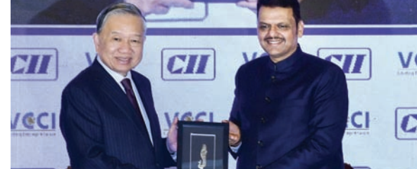
परिवर्तन और आर्थिक स्वायत्तता की बढ़ती मांगें दुनिया में हो रहे गहन परिवर्तन हैं। लाम ने यहां भारत-वियतनाम व्यापार मंच को संबोधित करते हुए कहा, "ये घटनाक्रम वियतनाम और भारत के लिए आर्थिक सहयोग को

मुंबई/भाषा। वियतनाम के राष्ट्रपति तो लाम ने बृहस्पतिवार को वैश्विक स्तर पर कृत्रिम बुद्धिमत्ता के आगमन जैसे "बड़े बदलावों" के मद्देनजर वियतनाम और भारत के बीच संबंधों को और प्रगाढ़ करने की वकालत की। लाम ने कहा कि वैश्विक आपूर्ति शृंखलाओं का पुनर्निर्माण, प्रमुख अर्थव्यवस्थाओं के बीच रणनीतिक प्रतिस्पर्धा, कृत्रिम बुद्धिमत्ता जैसी डिजिटल प्रौद्योगिकियों का उदय, हरित