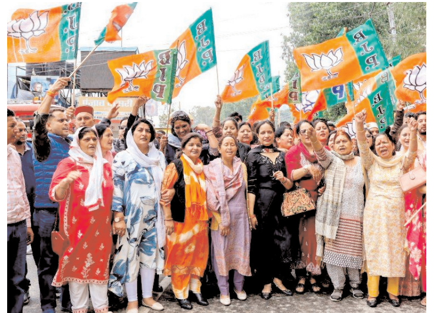
भाजपा कार्यकर्ता मंगलवार को कुलू के ढालपुर चौक पर असम, पुडुचेरी और पश्चिम बंगाल विधानसभा चुनावों में पार्टी की चुनावी जीत का जश्न मनाते हुए।