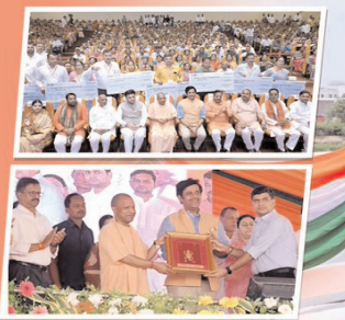
नौजवानों ने तो भटकना पड़ता है और न ही अपनी पहचान छुपानी पड़ती है। अकेले गोरखपुर में ही, औद्योगिक विकास

सुरक्षा की कमी थी। लोग माफिया और मच्छरों से परेशान थे। लोग गोरखपुर का नाम सुनने से भी डरते थे, और कोई निवेश करने नहीं आता था। यहां के युवाओं के सामने पहचान का संकट था। उन्हें नौकरियों के लिए भटकना पड़ता था और अपनी पहचान छुपानी पड़ती थी। मुख्यमंत्री ने गोरखपुर के तारामंडल इलाके में दो-लेने के पुल का उद्घाटन करने के बाद एक सभा को संबोधित करते हुए कहा, आज, सुरक्षा की कमी थी। लोग माफिया और मच्छरों से परेशान थे। लोग गोरखपुर का नाम सुनने से भी डरते थे, और कोई निवेश करने नहीं आता था। यहां के युवाओं के सामने पहचान का संकट था। उन्हें नौकरियों के लिए भटकना पड़ता था और अपनी पहचान छुपानी पड़ती थी।