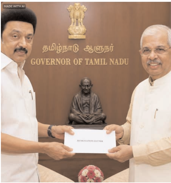
தமிழ்நாடு ஆளுநர் GOVERNOR OF TAMIL NADU