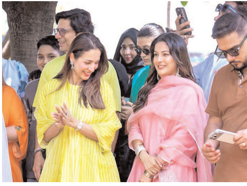
वर्ल्ड एनवायरनमेंट डे

एक्ट्रेस मलाइका अरोड़ा और शहनाज गिल महाराष्ट्र के मुंबई जिले में वर्ल्ड एनवायरनमेंट डे के मौके पर पेड लगाने के कैंपेन में शामिल हुईं।