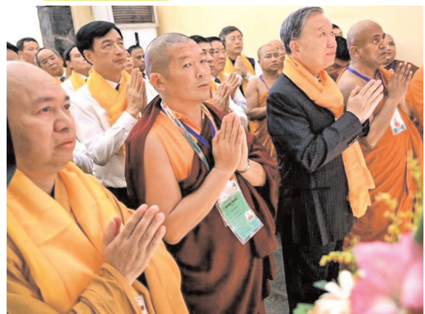
वियतनाम के राष्ट्रपति टो लैम मंगलवार को गया में अपने भारत दौरे के दौरान महाबोधि मंदिर में प्रार्थना करते हुए।