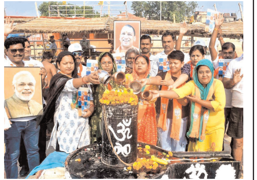
पश्चिम बंगाल के नतीजों की घोषणा से एक दिन पहले भाजपा समर्थकों ने जीत के लिए प्रार्थना की।