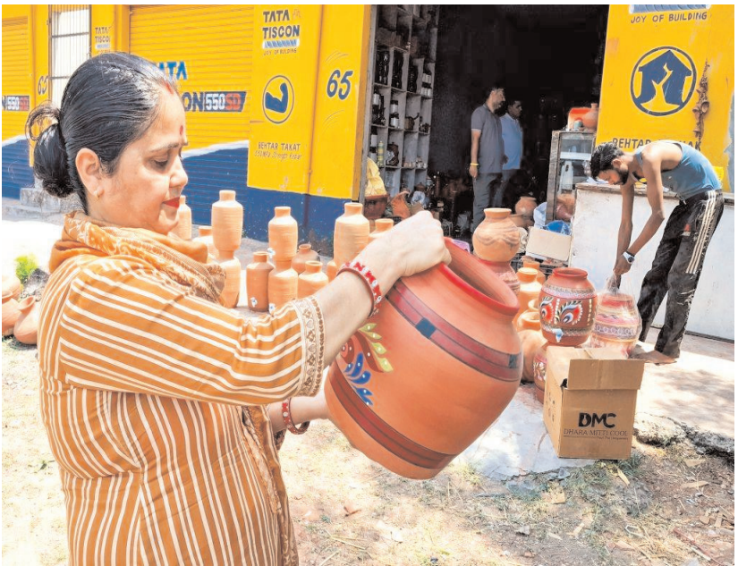
गर्मी के मौसम में सांबा में रविवार को एक दुकान पर मिट्टी का बर्तन खरीदती हुए एक महिला।