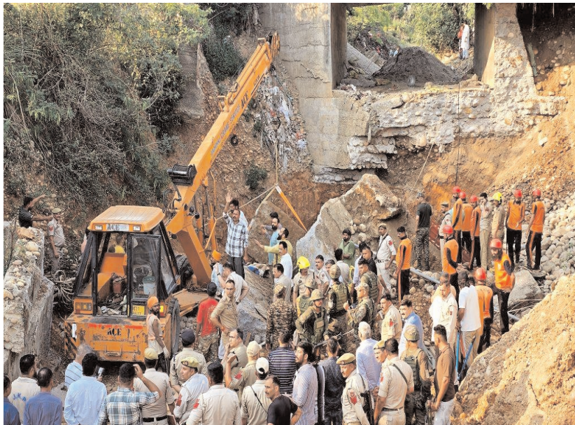
जम्मू और कश्मीर के जम्मू जिले में शक्रवार, को बंटालाब इलाके में एक अंडर-कंस्ट्रक्शन पुल गिरने के बाद मलबा हटाती एक जेसीबी, जिससे कई मजदूरों के मलबे में फंसे होने की आशंका बढ़ गई है।