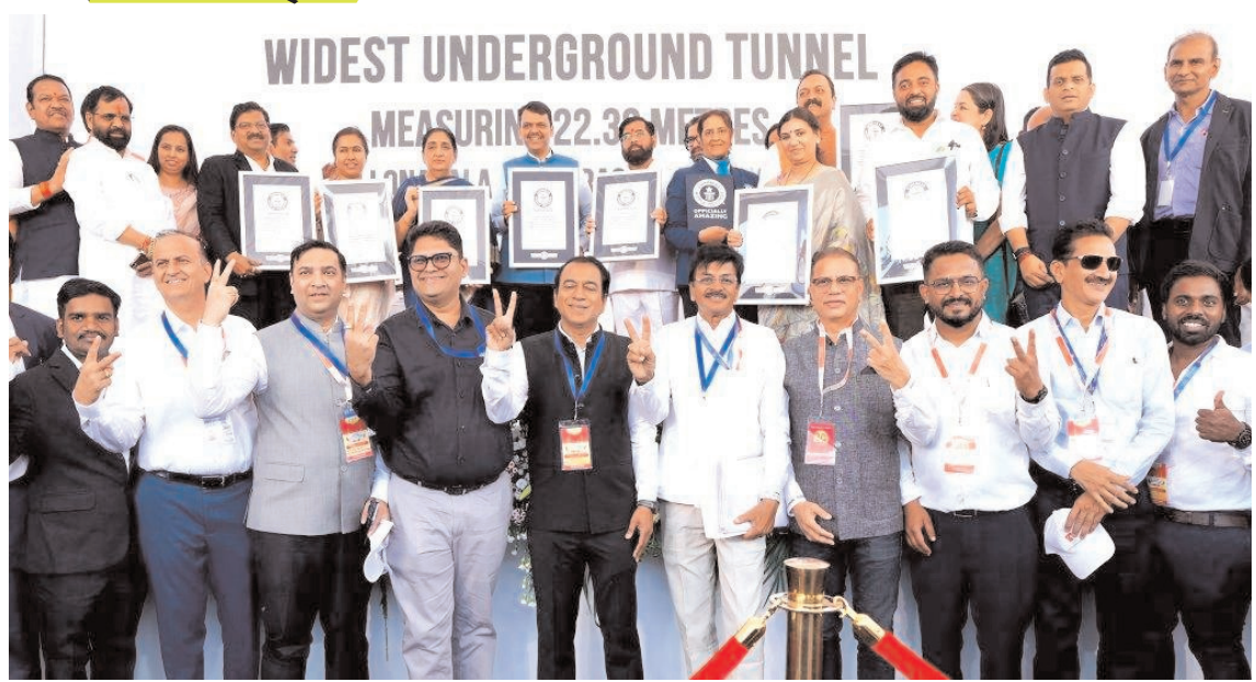
महाराष्ट्र के मुख्यमंत्री देवेंद्र फडणवीस, उप मुख्यमंत्री एकनाथ शिंदे और सुनेत्रा अजीत पवार को रायगढ़ के खालापूर में यशवंतराय चट्टण मुंबई-पुणे एक्सप्रेसवे के 'मिसिंग लिंक' प्रोजेक्ट के तहत बनी दुनिया की सबसे चौड़ी अंडरग्राउंड टनल के लिए गिनीज वर्ल्ड रिकॉर्ड्स सर्टिफिकेट लेते हुए।