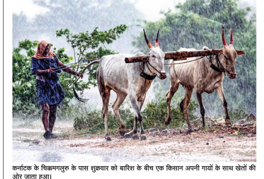
कर्नाटक के चिकमगलुरु के पास शुक्रवार को बारिश के बीच एक किसान अपनी गायों के साथ खेतों की ओर जाता हुआ।