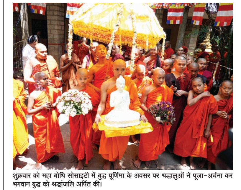
शुक्रवार को महा बोधि सोसाइटी में बुद्ध पूर्णिमा के अवसर पर श्रद्धालुओं ने पूजा-अर्चना कर भगवान बुद्ध को श्रद्धांजलि अर्पित की।