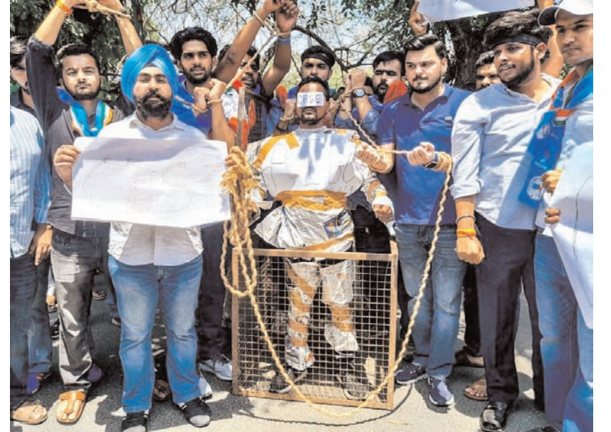
नई दिल्ली में शनिवार को नेशनल स्टूडेंट्स यूनियन ऑफ इंडिया के सदस्य नई दिल्ली के पटपड़गंज में सीबीएसई हेडक्वार्टर के बाहर विरोध प्रदर्शन करते हुए।