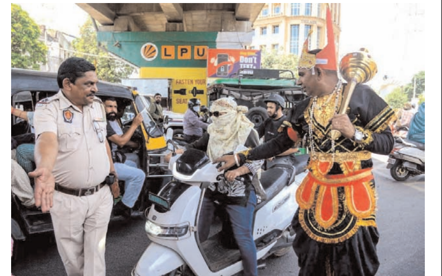
जालंधर में 'विश्व आपातकालीन चिकित्सा दिवस 2026' के अवसर पर फोटिस अस्पताल जालंधर द्वारा ट्रैफिक पुलिस कर्मियों के लिए आयोजित एक आपातकालीन प्रतिक्रिया कार्यशाला के दौरान, यमराज की पोशाक पहने एक व्यक्ति ने पुलिस कर्मियों के साथ मिलकर बिना हेलमेट के स्कूटी चला रहे एक सवार को रोका।