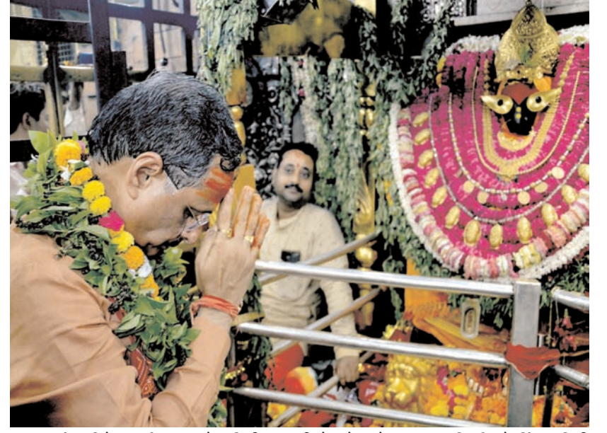
भाजपा सांसद दिनेश शर्मा बुधवार को 'पद्मिनी एकादशी' के त्योहार के अवसर पर मिर्जापुर के विंध्यवासिनी मंदिर में पूजा-अर्चना करते हुए।