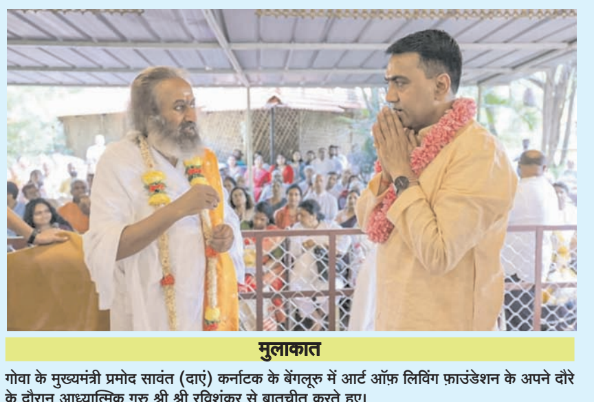
मुलाकात गोवा के मुख्यमंत्री प्रमोद सावंत (दाएं) कर्नाटक के बेंगलूरु में आर्ट ऑफ लिविंग फ्राउंडेशन के अपने दौरे के दौरान आध्यात्मिक गुरु श्री श्री रविशंकर से बातचीत करते हुए।

लोगों को गिरफ्तार किया गया। अधिकारी ने बताया कि बाद में गिरफ्तार किए गए चार लोगों में तीन विदेशी नागरिक हैं, जिनमें दो महिलाएं हैं। इन चारों आरोपियों को 17 मई को स्थानीय अदालत में पेश किया गया, जिसके बाद पुलिस 'ट्रांजिट वारंट' हासिल कर उन्हें बेंगलूरु लाई। यहां अदालत ने उन्हें 10 दिनों की पुलिस हिरासत में भेज दिया। अधिकारी ने बताया कि पूछताछ के दौरान पुलिस को इस गिराह में एक और व्यक्ति के शामिल होने का पता चला जिसे 18 मई को हिरासत में लिया गया। उन्होंने कहा, इस मामले में शामिल कुछ अन्य लोग अभी फरार हैं और उन्हें पकड़ने के प्रयास जारी हैं।