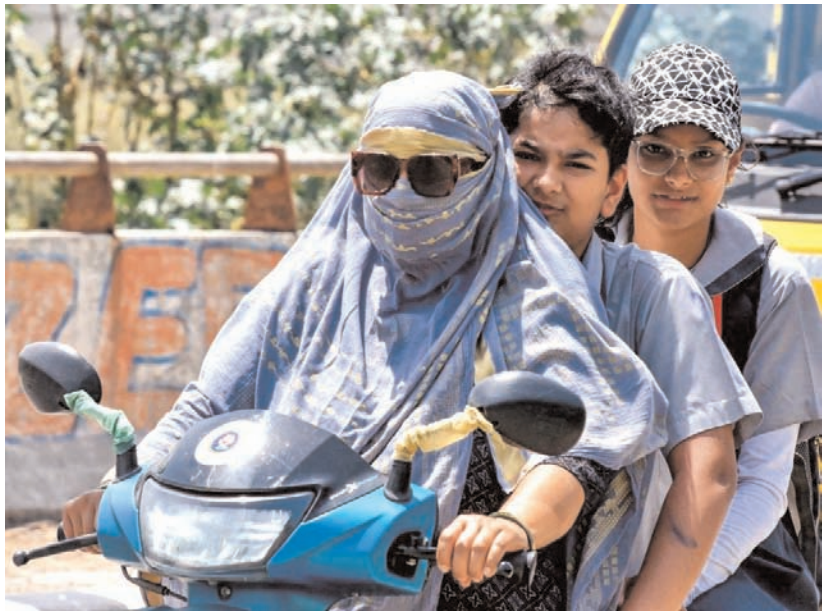
गांधियाबाद के वेव सिटी में भीषण गर्मी के बीच एक मां अपने बच्चों के साथ वाहन पर सफर करती नजर आई।