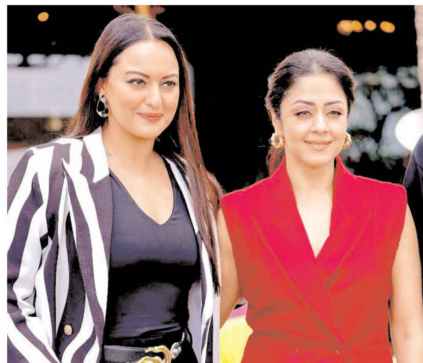
मुंबई में आगामी फिल्म 'सिस्टम' के प्रमोशनल इवेंट के दौरान अभिनेत्री सोनाक्षी सिन्हा और ज्योतििका सरवन्नन ने कैमरों के सामने पोज दिए।