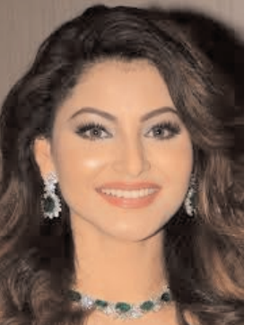
परफेक्ट दिखने की सोच को छोड़ना बहुत जरूरी होता है। उर्वशी ने कहा, लोग अक्सर मुझसे हर फ्रेम, हर एक्सप्रेशन और हर पल

बॉलीवुड अभिनेत्री उर्वशी रौतेला एक बार फिर वेब सीरीज 'इंस्पेक्टर अविनाश' के नए सीजन में पूनम मिश्रा के किरदार में नजर आने वाली हैं। इस बीच उर्वशी ने अपने किरदार और एक्टिंग को लेकर बात की। उन्होंने कहा कि उनकी पब्लिक इमेज हमेशा ग्लैमर से जुड़ी रही है, लेकिन 'इंस्पेक्टर अविनाश' जैसे प्रोजेक्ट्स में दिखावे से ज्यादा सच्ची भावनाओं की जरूरत होती है। उर्वशी ने आईएनएस से बताया कि एक कलाकार के तौर पर आगे बढ़ने के लिए 'परफॉर्मिस वैनिटी' यानी