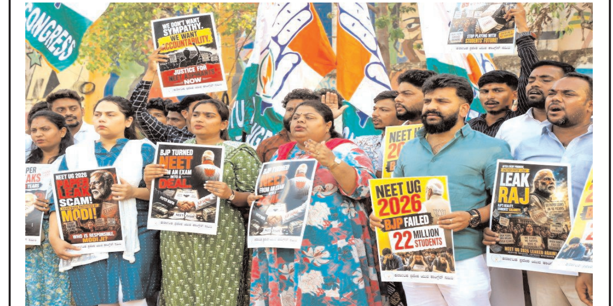
कर्नाटक प्रदेश युथ कांग्रेस कमेटी के सदस्य मंगलवार को बंगलूर में कथित पेपर लीक के कारण नीट-यूजी परीक्षा रद्द होने के खिलाफ विरोध प्रदर्शन करते हुए।