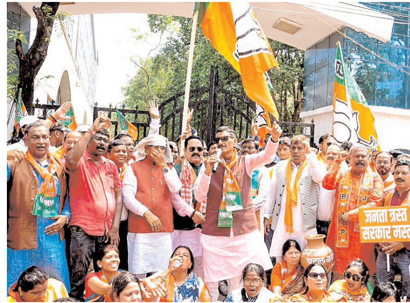
रक्षा राज्य मंत्री संजय सेठ ने भाजपा की 'आक्रोश रेली' के दौरान भाषण दिया। झारखंड में कथित पानी और बिजली संकट को लेकर मंगलवार रांची में कलेक्ट्रेट के बाहर प्रदर्शन किया।