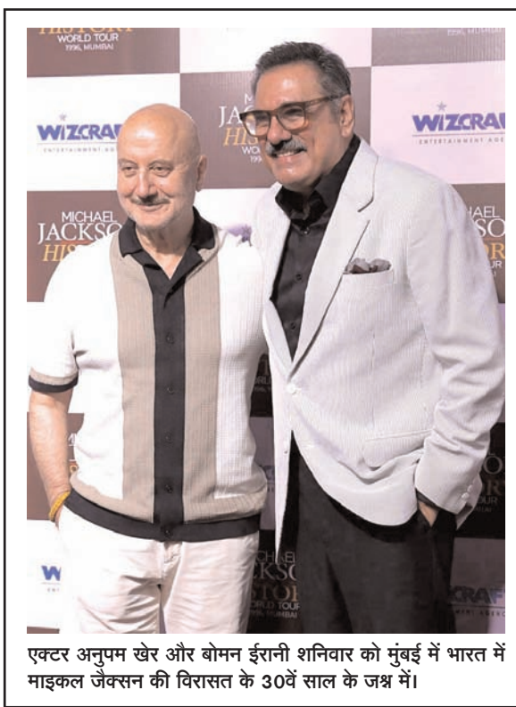
एक्टर अनुपम खेर और बोमन ईरानी शनिवार को मुंबई में भारत में माइकल जैक्सन की विरासत के 30वें साल के जश्न में।

छोटी सी गलती भी दर्शकों के तुरंत पकड़ में आ जाती है, इसलिए मैं हर शब्द के उच्चारण और बोलने के अंदाज को लेकर बहुत सावधान रहती थी। उन्होंने कहा, इस किरदार को निभाने समय में यह भी समझने की कोशिश कर रही थी कि उस इलाके के लोग कैसे बात करते हैं, कैसे अपनी भावनाएं व्यक्त करते हैं और किस तरह का लहजा इस्तेमाल करते हैं। जब तक कलाकार किरदार की भाषा को सही तरीके से नहीं समझता, तब तक वह उस किरदार के साथ पूरी तरह न्याय नहीं कर सकता।