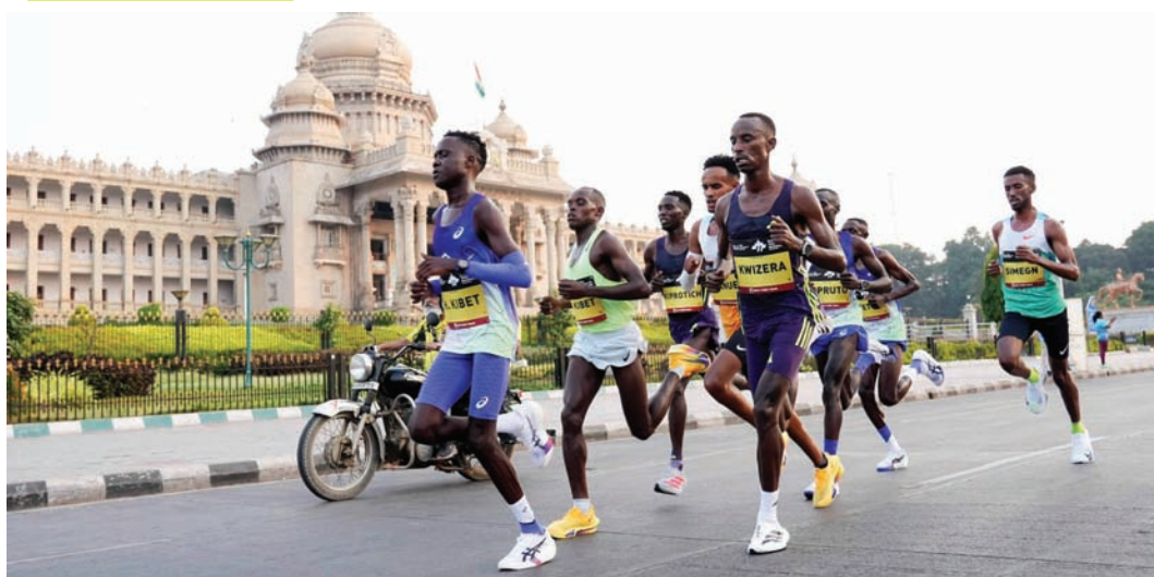
रविवार को आयोजित टीसीएस वर्ल्ड 10के बंगलूरु 2026 मेराथॉन में 35,000 से अधिक धावकों ने हिस्सा लिया। वर्ल्ड एथलेटिक्स गोल्ड लेबल की इस 18वीं रेस में विभिन्न श्रेणियों में रिकॉर्डतोड़ प्रदर्शन देखने को मिला।