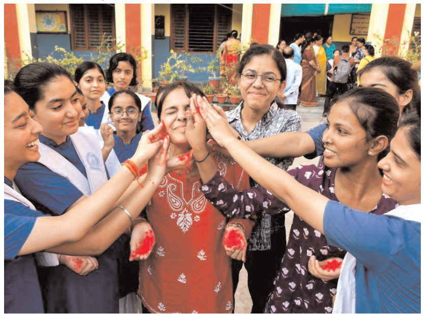
प्रयागराज में गुरुवार को उत्तर प्रदेश बोर्ड परीक्षा के नतीजों की घोषणा के बाद स्टूडेंट्स एक रकूटेंट को गुलाल लगाते हुए।