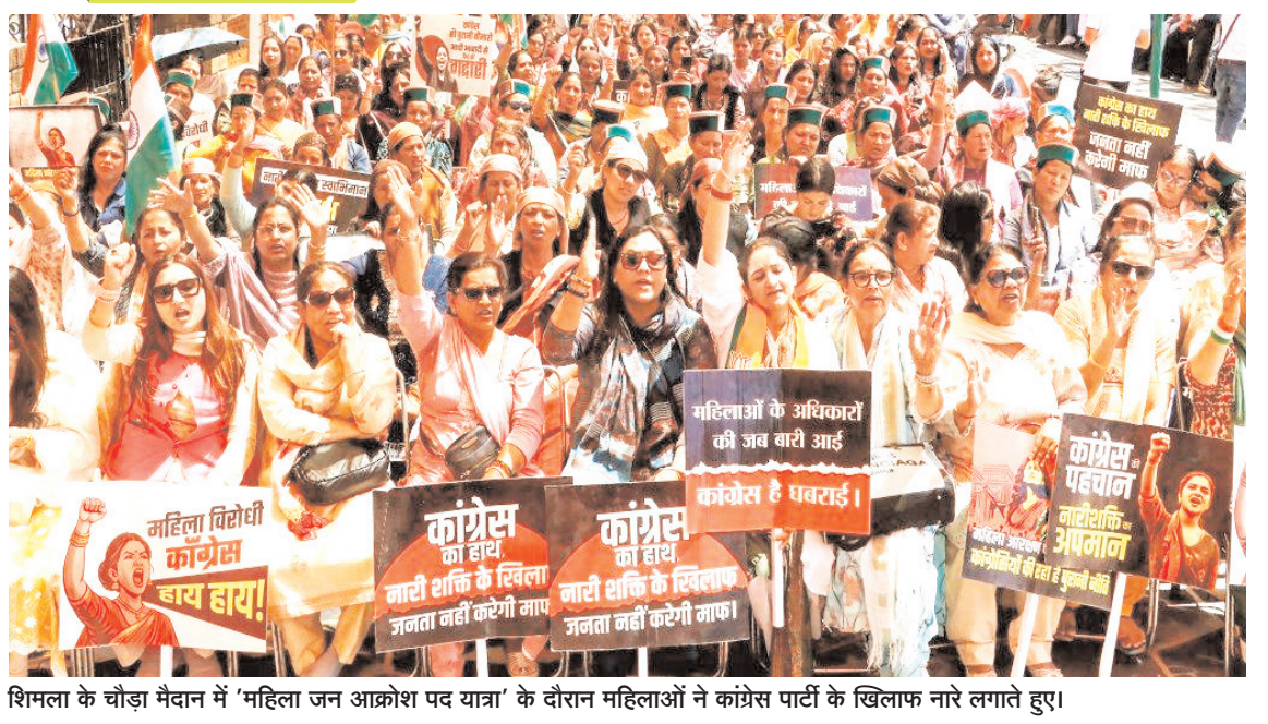
शिमला के चौड़ा मैदान में 'महिला जन आक्रोश पद यात्रा' के दौरान महिलाओं ने कांग्रेस पार्टी के खिलाफ नारे लगाते हुए।