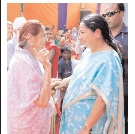
दिल्ली की मुख्यमंत्री रेखा गुप्ता बुधवार को नई दिल्ली के शालीमार बाग विधानसभा क्षेत्र में वाटर एटीएम के उद्घाटन के मौके पर।

गर्मियों का मौसम आते ही लोग अपनी सेहत को लेकर ज्यादा सतर्क हो जाते हैं। खासतौर पर इस मौसम में पाचन संबंधी परेशानियां ज्यादा होती हैं, इसलिए खानपान पर ध्यान देना बेहद जरूरी होता है। ऐसे में कई सेलेब्रिटीज भी अपने हेल्दी रूटीन को फैंस के साथ साझा करते रहते हैं। इसी कड़ी में टीवी की जानी-मानी अभिनेत्री मुनमुन दत्ता ने अपने समर मॉर्निंग रूटीन की एक झलक सोशल मीडिया पर शेयर की, जो अब खूब चर्चा में है। ‘तारक मेहता का उल्टा चश्मा’ में बबीता का किरदार निभाकर घर-घर में पहचान बना चुकीं मुनमुन दत्ता ने अपने इंस्टाग्राम पोस्ट के जरिए बताया कि वह सुबह की शुरुआत किस तरह से करती हैं। उन्होंने इंस्टाग्राम स्टोरी एक वीडियो और कुछ तस्वीरें साझा कीं, जिनमें उनके हेल्दी नाश्ते की झलक देखने को मिल रही है। इस पोस्ट के साथ उन्होंने कैप्शन में लिखा, “मैंने सुबह के लिए एक ऐसी झिंक तैयार की है, जो पेट की सेहत के लिए बेहद फायदेमंद है और शरीर को अंदर से मजबूत बनाती है।” वीडियो में देखा जा सकता है कि मुनमुन छाछ से कुछ बना रही हैं, जिसे वह पेट की सेहत के लिए बेहतर रूटीन बताना है। इससे बनाते समय उन्होंने उसमें बारीक कटा हुआ प्याज और हरा धनिया समेत कई चीजों को मिलाया। इसके अलावा, मुनमुन ने एक तस्वीर के जरिए एक और खास झिंक के बारे में जानकारी दी, जिसे रागी अंबली कहा जाता है। उन्होंने कैप्शन में बताया, “यह देसी पेय पाचन को बेहतर बनाता है। साथ ही यह गर्मियों में शरीर को ठंडक पहुंचाने का भी काम करता है। यह शरीर को हल्का महसूस कराता है।” मुनमुन दत्ता अपने फिटनेस के लिए जानी जाती हैं। वह अक्सर अपने सोशल मीडिया अकाउंट पर व्यायाम और योग से जुड़े वीडियो और तस्वीरें साझा करती रहती हैं।