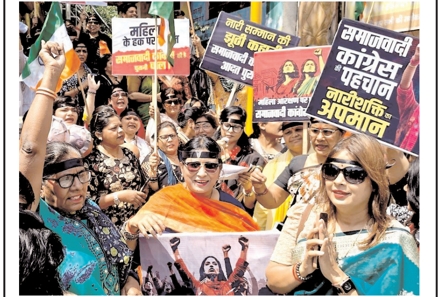
भारतीय जनता पार्टी के नेता और कार्यकर्ता बुधवार को श्रीनगर में पहलगाम आतंकी हमले में मारे गए पीड़ितों को श्रद्धांजलि देते हुए।