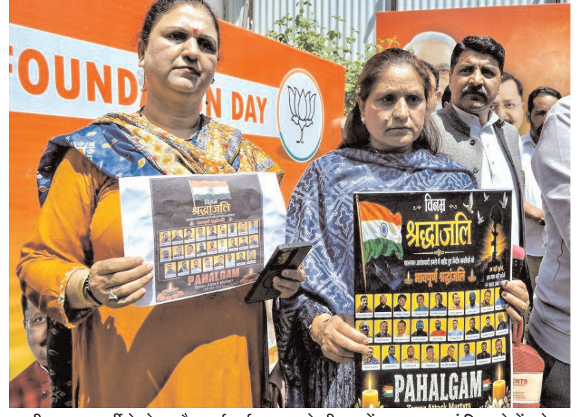
भारतीय जनता पार्टी के नेता और कार्यकर्ता बुधवार को श्रीनगर में पहलगाम आतंकी हमले में मारे गए पीड़ितों को श्रद्धांजलि देते हुए।