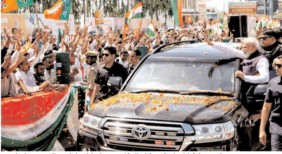
उत्तर प्रदेश के सहारनपुर में एक बड़े रोड शो के दौरान प्रधानमंत्री नरेंद्र मोदी का भीड़ से गर्मजोशी से स्वागत किया गया।