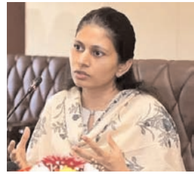
देश की सभी महिलाओं के लिए एक निर्णायक कदम के रूप में उठाया गया है। खड्गे ने कहा, आज महिलाएं लोकसभा और राज्य विधानसभाओं में खुद अपना प्रतिनिधित्व कर रही हैं। इस

में महिलाओं के लिए 33 फीसदी आरक्षण के प्रावधान वाला यह अधिनियम केवल महिलाओं का प्रतिनिधित्व बढ़ाने के लिए नहीं है, बल्कि फैसेल लेने में उनकी अधिक भूमिका का विस्तार करने के लिए भी है। खड्गे ने कहा कि सरकार इस अधिनियम को जल्द से जल्द लागू करने की दिशा में काम कर रही है, जिसके लिए 16 से 18 अप्रैल तक संसद की बैठक बुलाई गई है। उन्होंने कहा, यह भारत के लोकतंत्र में लिए गए सबसे ऐतिहासिक फैसलों में से एक है, जिसे प्रधानमंत्री नरेंद्र मोदी और उनकी सरकार के नेतृत्व