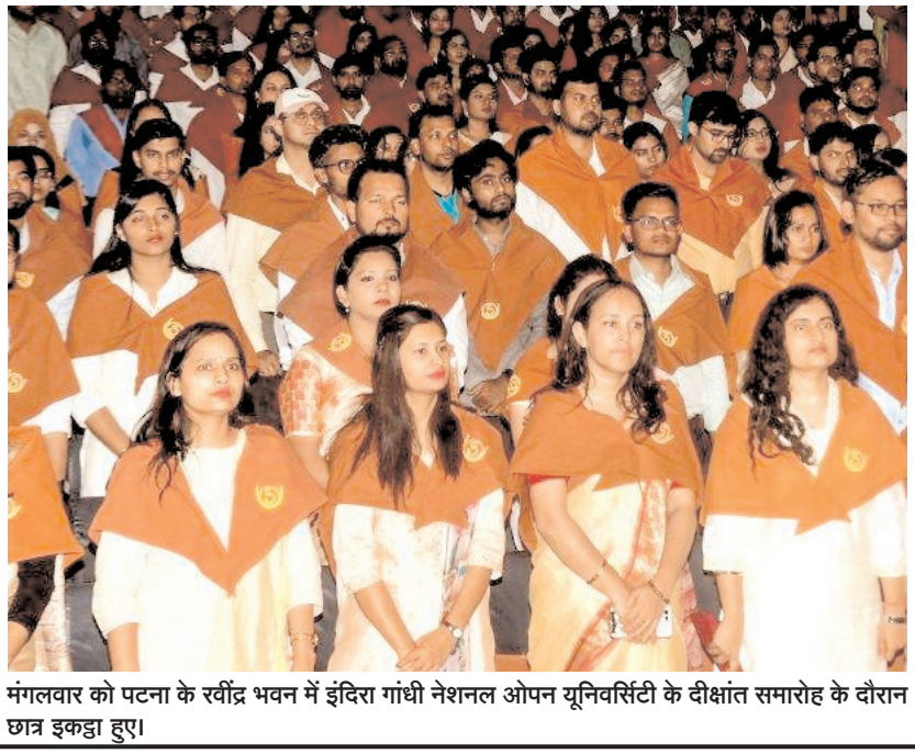
मंगलवार को पटना के रवींद्र भवन में इंदिरा गांधी नेशनल ओपन यूनिवर्सिटी के दीक्षांत समारोह के दौरान छात्र इकट्ठा हुए।