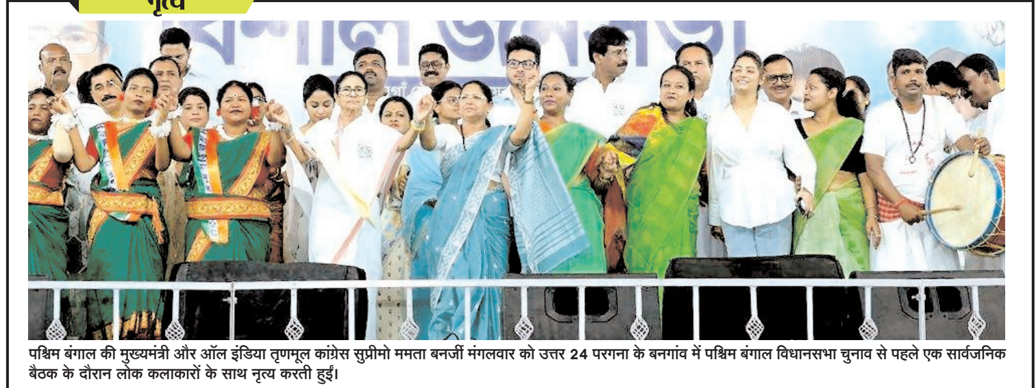
पश्चिम बंगाल की मुख्यमंत्री और ऑल इंडिया तुण्मूल कांग्रेस सुप्रीमो ममता बनर्जी मंगलवार को उत्तर 24 परगना के बंगांव में पश्चिम बंगाल विधानसभा चुनाव से पहले एक सार्वजनिक बैठक के दौरान लोक कलाकारों के साथ नृत्य करती हुईं।