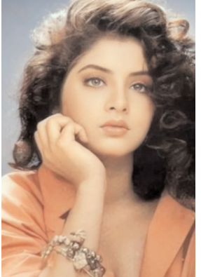
दिव्या ने अपने छोटे से करियर में शाहरुख खान और ऋषि कपूर जैसे

मुंबई/एजेन्सी। अभिनेत्री सोमी अली ने 5 अप्रैल को दिवंगत सुपरस्टार दिव्या भारती की 33वीं पुण्यतिथि पर उन्हें सोशल मीडिया पर श्रद्धांजलि दी। अपनी दोस्त दिव्या को याद करते हुए अभिनेत्री ने उन्हें असाधारण प्रतिभा का प्रतीक बताया। 90 के दशक के एक फोटोशूट की दिव्या की तस्वीर साझा करते हुए सोमी ने लिखा, तुम्हें बहुत याद कर रही हूँ! तुम्हारी आत्मा को शांति मिले, मेरी दोस्त। हमने एक खूबसूरत युवती और असाधारण प्रतिभा की प्रतीक को