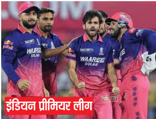
इंडियन प्रीमियर लीग

बारिश के कारण मुकामला दो घंटे और 40 मिनट के विलंब से शुरू किया जिसके कारण इसे 11 ओवर का कर दिया गया। रॉयल्स के 151 रन के लक्ष्य का पीछा करते हुए मुंबई की टीम कभी लक्ष्य हासिल करने की स्थिति में नहीं दिखाई और नौ विकेट पर 123 रन ही बना सकी।