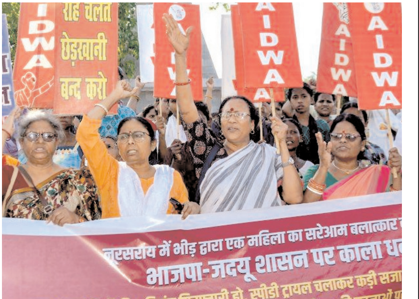
नालंदा के नूरसराय इलाके में एक महिला के साथ कथित मारपीट के खिलाफ रविवार को पटना में अलग-अलग संगठनों की महिला सदस्यों ने विरोध प्रदर्शन किया।