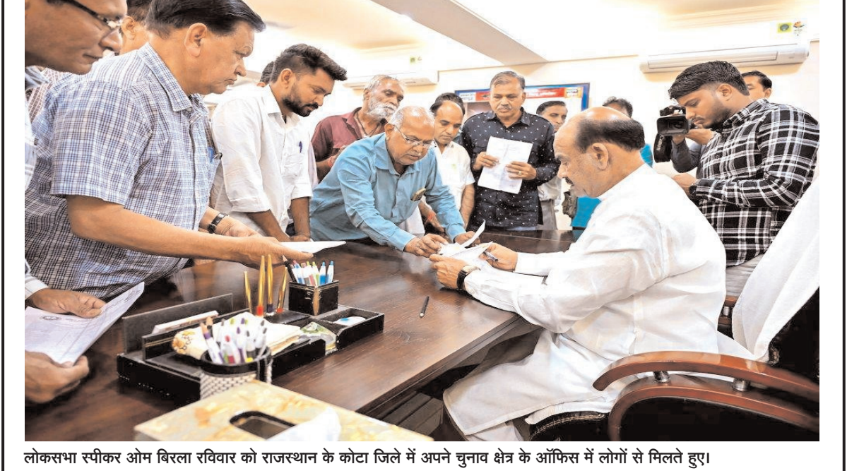
लोकसभा स्पीकर ओम बिरला रविवार को राजस्थान के कोटा जिले में अपने चुनाव क्षेत्र के ऑफिस में लोगों से मिलते हुए।