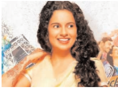
फिल्म में कंगना का लोकप्रिय किरदार 'रानी' इस बार विदेश यात्रा के बजाय भारत के विभिन्न शहरों की सैर करता नजर आएगा। कहानी आत्म-खोज के नए अध्याय पर आधारित होगी, जिसमें रानी