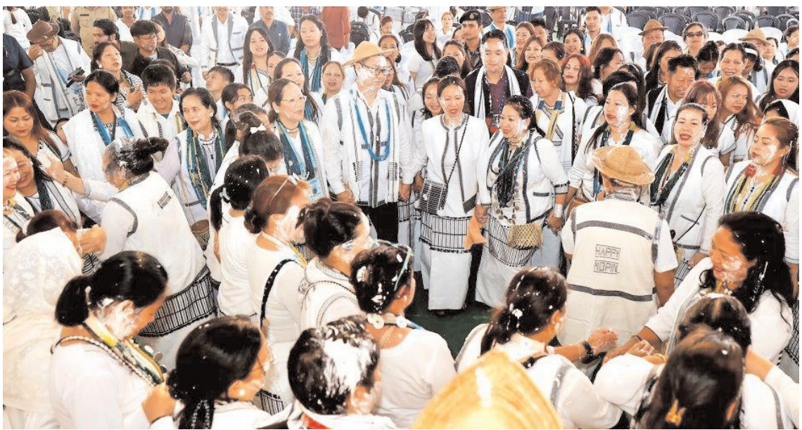
केंद्रीय मंत्री किरन रिजजू रविवार को इटानगर के मोपिन-सोलंग ग्राउंड में डायमंड जुबली मोपिन फेस्टिवल सेलिब्रेशन में शामिल हुए।