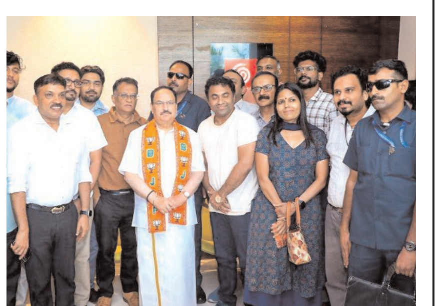
केंद्रीय मंत्री जगत प्रकाश नड्डा रविवार को केरल के तिरुवनंतपुरम में एक इवेंट के दौरान मेडिकल प्रोफेशनल्स से बातचीत करते हुए।