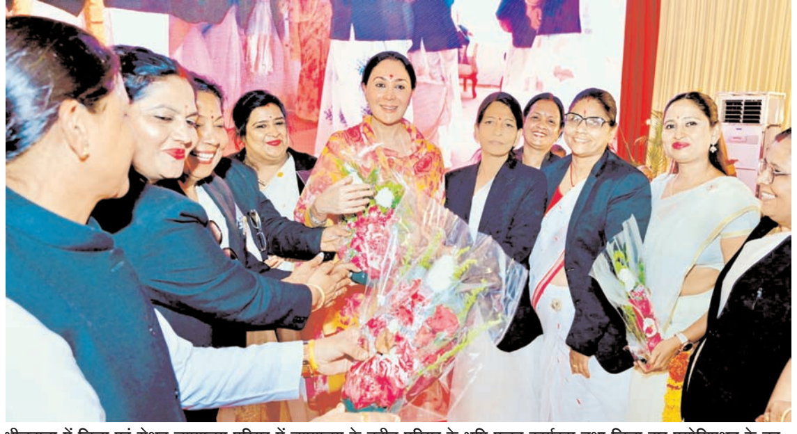
भीलवाड़ा में जिला एवं सेशन न्यायालय परिसर में न्यायालय के नवीन परिसर के भूमि पूजन कार्यक्रम तथा जिला बार एसोसिएशन के नव-निर्वाचित पदाधिकारियों के शपथ ग्रहण समारोह में शिरकत करती उपमुख्यमंत्री दिया कुमारी।