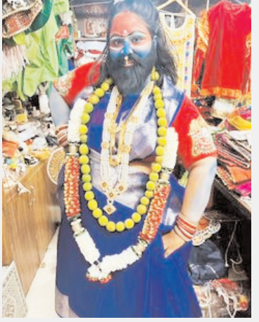
प्रतिमाएं नजर आएंगी। गत वर्ष जालौरी गेट से चांद बावड़ी तक 15 गवर की प्रतिमाएं बैठाई गईं। इसके अलावा आडाबाजार, मोती चौक सहित अन्य क्षेत्रों में भी पांच से सात जगह पर गवर थीं, लेकिन सर्वाधिक सोना सुनारों की घाटी की गवर को पहनाया जाता है। यहां 12 से 15 किलो सोने के जेवर पहनाए जाते हैं।

जोधपुर। पूरी दुनिया में महिलाओं के अनूठे त्योहार के रूप में प्रसिद्ध जोधपुर का धीगा गवर मेला, जिसे बेंतमार मेला भी कहते हैं, का आयोजन रविवार को होगा। रविवार की पूरी रात भीतरी शहर की सड़कों पर महिलाओं का ही राज होगा। इस मेले के लिए इन दिनों तिजणियों का पूजन अंतिम दौर में है। शनिवार को शहर के अलग-अलग मोहल्लों में पूजन हो रहा है। इसमें उत्साह से महिलाएं भाग ले रही हैं। पूजन करने वाली तीजणियों के 16 दिन रत रखते हैं। रविवार मेले में अलग-अलग रूप धरने की तैयारियां भी शुरू हो गई हैं। इसके साथ ही भीतरी शहर में एक दर्जन से ज्यादा स्थानों पर मेले के दिन गवर बैठाने के लिए भी तैयारियां जोरों पर हैं। गवर को पहनाए जाने वाले सोने से ही उस मोहल्ले की समृद्धि आंकी जाती है। सुनारों की घाटी में सर्वाधिक सोने से सजाया जाता है गवर को। रविवार को शहर के परकोटे के भीतर हर गली मोहल्ले में धीगा गवर