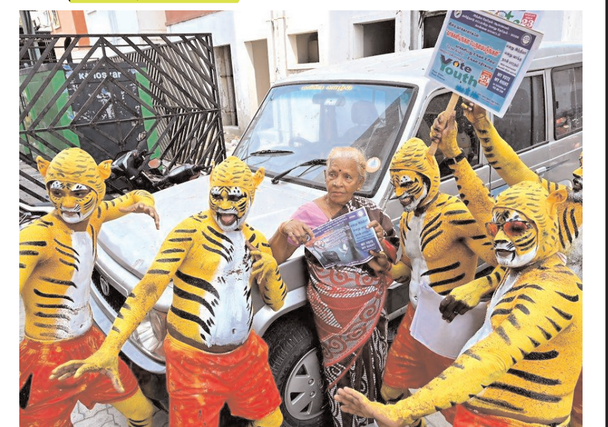
चेन्नई में 2026 के विधानसभा चुनावों से पहले मतदाता जागरूकता बढ़ाने के लिए 'ग्रेटर चेन्नई कॉर्पोरेशन' द्वारा आयोजित कार्यक्रम में बाघ की वेशभूषा में कलाकारों ने लोगों को मतदान के लिए प्रेरित किया।