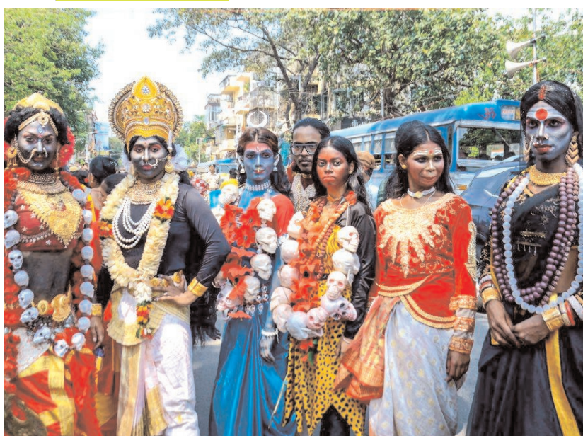
कोलकाता में गुरुवार को हाजरा क्रॉसिंग पर पश्चिम बंगाल विधानसभा चुनाव से पहले भाजपा उम्मीदवारों के सपोर्ट में केंद्रीय गृह मंत्री अमित शाह के रोड शो के दौरान कलाकार परफॉर्म करते हुए।