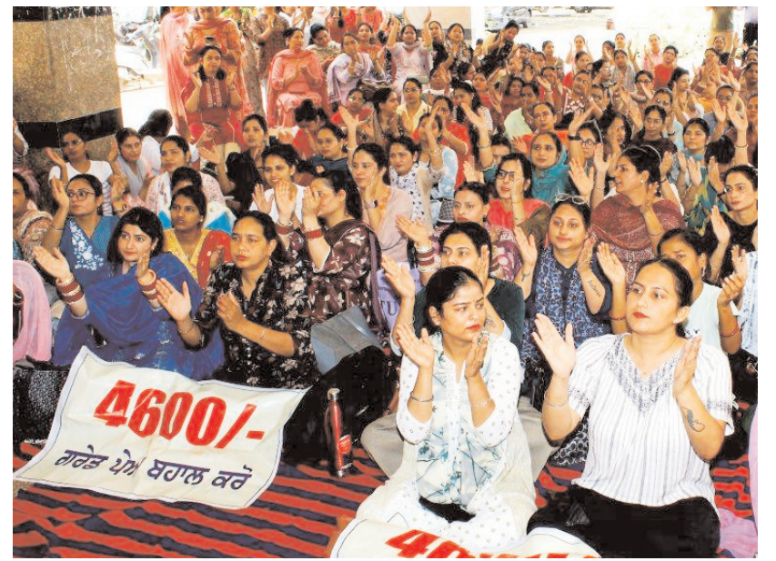
यूनाइटेड नरिंग एसोसिएशन के सदस्य गुरुवार को अमृतसर के गुरु नानक देव हॉस्पिटल में ग्रेड पे की अपनी मांग के सपोर्ट में पंजाब सरकार के खिलाफ विरोध प्रदर्शन के दौरान नारे लगाते हुए।