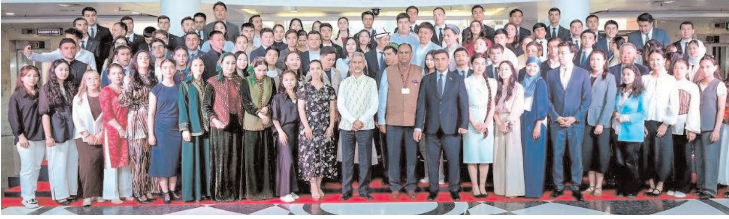
विदेश मंत्री एस. जयशंकर बुधवार को नई दिल्ली में मध्य एशियाई देशों का प्रतिनिधिमंडल से बातचीत करते हुए।