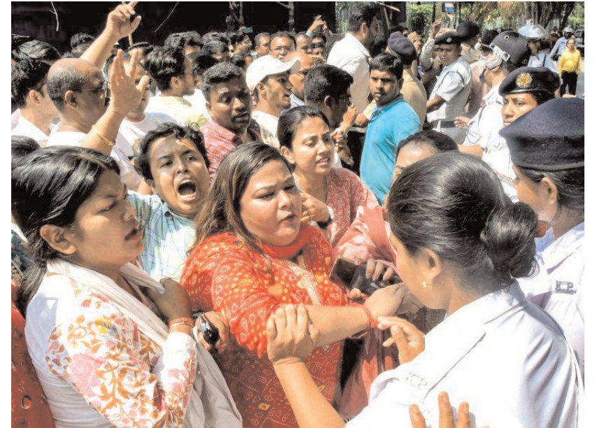
कोलकाता में मुख्य चुनाव अधिकारी के ऑफिस के बाहर बृथ लेवल ऑफिसर ने विरोध प्रदर्शन किया।