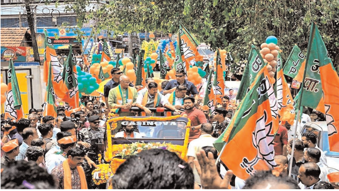
भारतीय जनता पार्टी के राष्ट्रीय अध्यक्ष, नितिन गडकरी ने केरल विधानसभा चुनाव से पहले पार्टी उम्मीदवार के समर्थन में एक रोड शो किया।