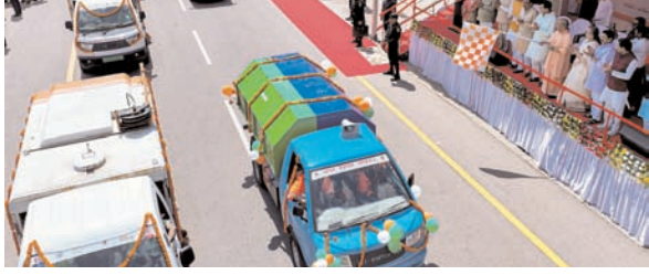
के उद्देश्य से लगभग 250 इलेक्ट्रिक और सीएनजी से चलने वाले वाहनों को हरी झंडी दिखाने के बाद सभा को संबोधित कर रहे थे। आदित्यनाथ ने कहा, 'हमने

लखनऊ/भाषा। उत्तर प्रदेश के मुख्यमंत्री योगी आदित्यनाथ ने लखनऊ में पर्यावरण अनुकूल कचरा प्रबंधन वाहनों के एक बेड़े को हरी झंडी दिखाते हुए समाजवादी पार्टी पर तीखा हमला बोला और कहा कि उनकी सरकार ने राज्य से 'कचरे की राजनीति को हटा दिया है।' मुख्यमंत्री लखनऊ में दोस अपशिष्ट प्रबंधन को मजबूत करने