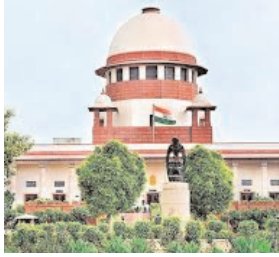
व्यावहारिक समाधान निकाला जाना चाहिए।

न्यायमूर्ति जे बी पारदीवाला और न्यायमूर्ति के वी विश्वनाथन की पीठ ने घर खरीदारों और भूमि स्वामित्व एजेंसियों के वकीलों से भी एक सप्ताह के भीतर दो पत्रों का नोट दाखिल करने को कहा, जिसमें लंबे समय से चले आ रहे इस मुद्दे के समाधान को सुझाव हों। शीर्ष अदालत ने सुनवाई के दौरान कहा, हमारा उद्देश्य घर खरीदारों को घर मुहैया कराना है। पीठ ने इस बात पर भी जोर दिया कि मामले का कोई न कोई