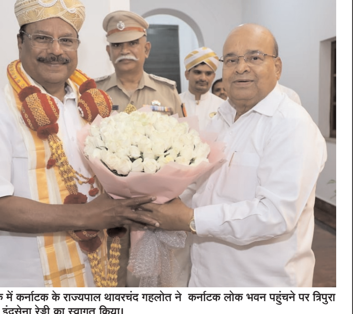
बुधवार को बेंगलूरु में कर्नाटक के राज्यपाल थावरचंद गहलोत ने कर्नाटक लोक भवन पहुंचने पर त्रिपुरा के राज्यपाल एन. इंद्रसेना रेड्डी का स्वागत किया।