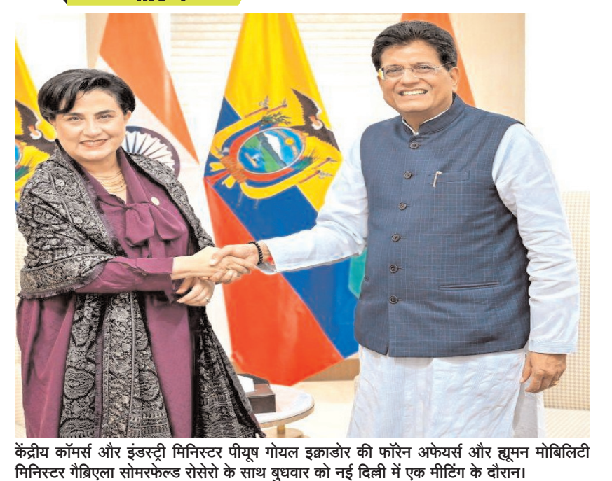
केंद्रीय कॉमर्स और इंडस्ट्री मिनिस्टर पीयूष गोयल इकाडोर की फॉरेन अफेयर्स और ह्युमन मोबिलिटी मिनिस्टर गैब्रिएला सोमरफेल्ड रोसेरो के साथ बुधवार को नई दिल्ली में एक मीटिंग के दौरान।