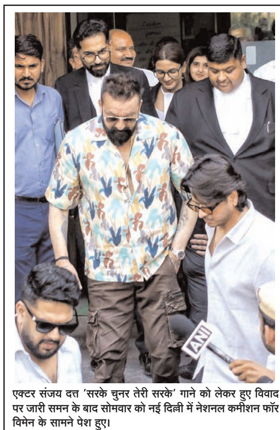
एक्टर संजय दत्त 'सरके चुनर तेरी सरके' गाने को लेकर हुए विवाद पर जारी सामन के बाद सोमवार को नई दिल्ली में नेशनल कमीशन फॉर विमेन के सामने पेश हुए।