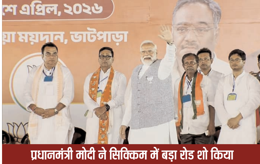
प्रधानमंत्री मोदी ने सिक्किम में बड़ा रोड शो किया

मोदी ने कहा, "पश्चिम बंगाल में मैं जहां कहीं भी गया, मैंने जो माहौल महसूस किया है, उससे मैं कह सकता हूँ कि चार मई के बाद भाजपा सरकार के शपथ ग्रहण समारोह में मुझे फिर से आना होगा।" इस पर भीड़ ने जोरदार तालियां बजाईं। बैरकपुर के ऐतिहासिक महत्व का जिक्र करते हुए, प्रधानमंत्री ने कहा कि इस भूमि में 1857 में भारत के पहले स्वतंत्रता संग्राम में महत्वपूर्ण भूमिका निभाई थी और अब यह पश्चिम बंगाल में राजनीतिक परिवर्तन का आधार तैयार कर रही है। प्रधानमंत्री मोदी ने कहा कि भारत के समग्र विकास के लिए पश्चिम बंगाल की प्रगति आवश्यक है। उन्होंने जोर दिया कि पूर्वी क्षेत्र का उदय देश के भविष्य के लिए महत्वपूर्ण है। उन्होंने कहा, अतीत में, जब भारत समृद्ध था, तब उसके तीन मजबूत स्तंभ थे - अंग, बंग और कलिंग - जो आज के बिहार, बंगाल और ओडिशा हैं। जब ये तीनों स्तंभ कमजोर हुए, तो इससे भारत की शक्ति को गहरा आघात पहुंचा। पूर्वी भारत के उदय के बिना राष्ट्र का उदय अधूरा है। पड़ोसी राज्यों में भाजपा की जीत का