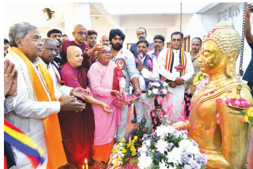
मुख्यमंत्री सिद्धरामय्या ने सोमवार को बेंगलूरु के सदाशिव नगर स्थित नागसेना बुद्ध विहार में आयोजित विश्व बौद्ध महासम्मेलन का उद्घाटन किया।