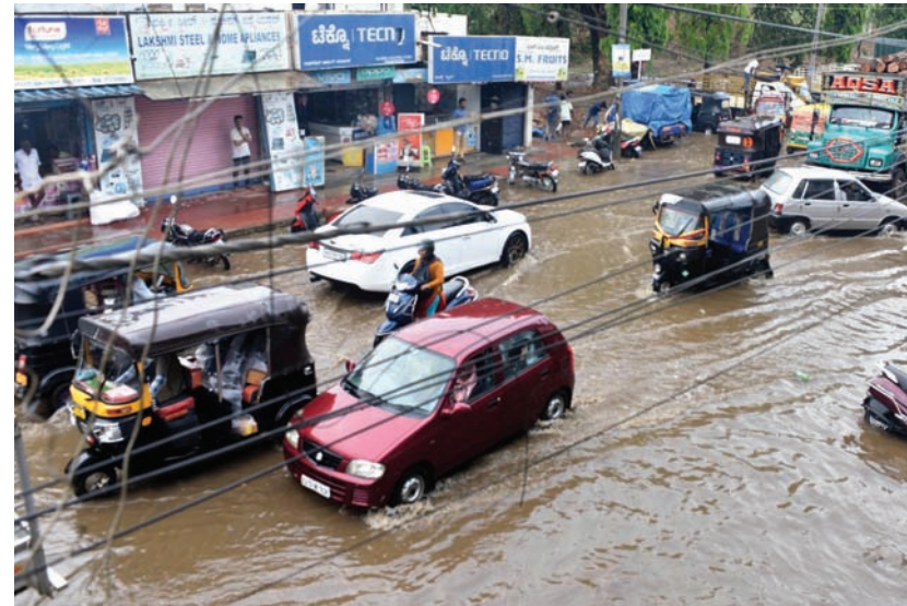
बिक्कमगलूर में सोमवार को रुक-रुक कर हुई बारिश के बाद सड़कों पर जलभराव की स्थिति बन गई, जिससे वाहन चालकों और आम लोगों को आवागमन में काफी परेशानी का सामना करना पड़ा। कई जगहों पर सड़कें पानी में डूबी नजर आईं और ट्रैफिक की रफ्तार धीमी पड़ गई।