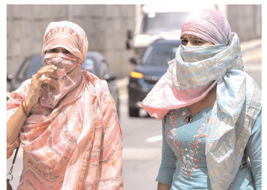
गाजियाबाद में सोमवार को गाजियाबाद में एनएच-24 पर काजीपुरा में थिलचिलती गर्मी से बचने के लिए स्कार्फ से अपना चेहरा ढककर चलती महिलाएं।