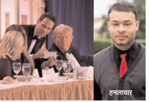
दक्षिण भारत राष्ट्रमत dakshinbharat.com