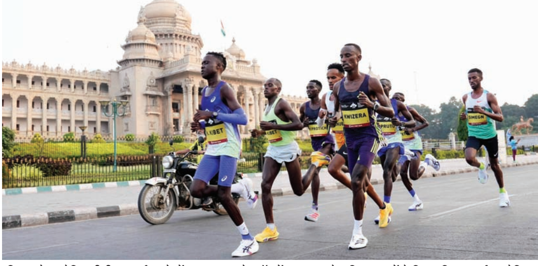
रविवार को आयोजित टीसीएस वर्ल्ड 10के बेंगलूर 2026 मेराथॉन में 35,000 से अधिक धावकों ने हिस्सा लिया। वर्ल्ड एथलेटिक्स गोल्ड लेबल की इस 18वीं रेस में विभिन्न श्रेणियों में रिकॉर्डतोड़ प्रदर्शन देखने को मिला।