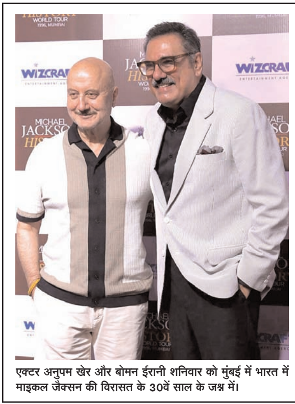
एक्टर अनुपम खेर और बोमन ईरानी शनिवार को मुंबई में भारत में माइकल जैक्सन की विरासत के 30वें साल के जन्म में

बारीकियों को समझने का मौका मिला। हंसिका ने आगे कहा, यह अनुभव मेरे लिए बिल्कुल नया था। मैंने पहले कभी इस तरह की बोली या लहजे में काम नहीं किया। यही वजह थी कि शुरुआत में मुझे काफी प्रैक्टिस करनी पड़ी। किसी खास बोली में अभिनय करना आसान नहीं होता, क्योंकि अगर एक छोटा सा शब्द भी गलत बोल दिया जाए तो वह तुरंत लोगों को महसूस हो जाता है। छोटी सी गलती भी दर्शकों के तुरंत पकड़ में आ जाती है, इसलिए मैं हर शब्द के उच्चारण और बोलने के अंदाज को लेकर बहुत सावधान रहती थी। उन्होंने कहा, इस किरदार को निभाने समय में यह भी समझने की कोशिश कर रही थी कि उस इलाके के लोग कैसे बात करते हैं, कैसे अपनी भावनाएं व्यक्त करते हैं और किस तरह का लहजा इस्तेमाल करते हैं। जब तक कलाकार किरदार की भाषा को सही तरीके से नहीं समझता, तब तक वह उस किरदार के साथ पूरी तरह न्याय नहीं कर सकता।