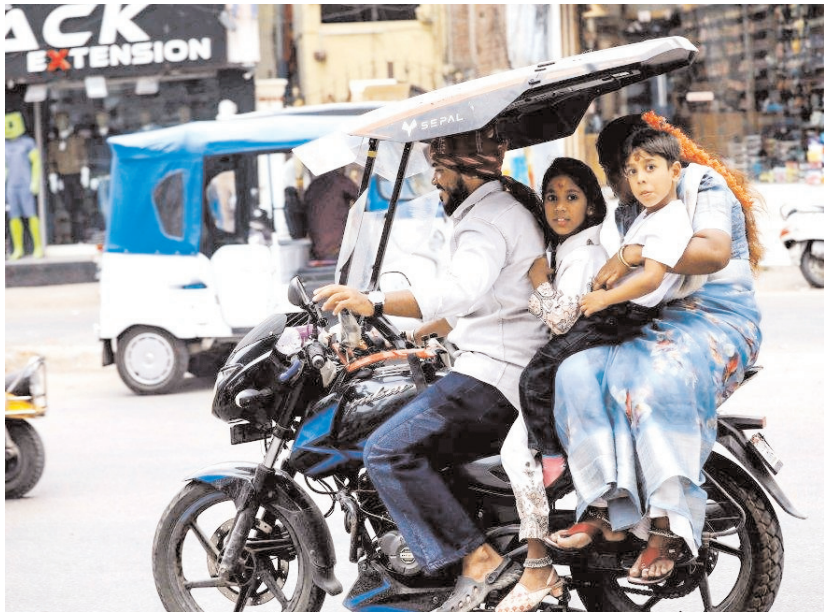
हैदराबाद में शुक्रवार को एक यात्री अपने परिवार के साथ टू-व्हीलर पर सवार है और उन्हें धिलचिलाती गर्मी से बचाव करता हुआ।