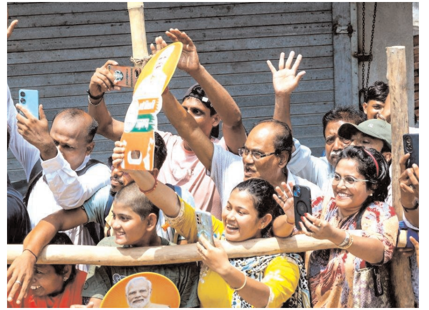
कोलकाता के दमदम में पश्चिम बंगाल विधानसभा चुनाव से पहले प्रधानमंत्री नरेंद्र मोदी के रोड शो के दौरान समर्थक खुशी से झूमते हुए।