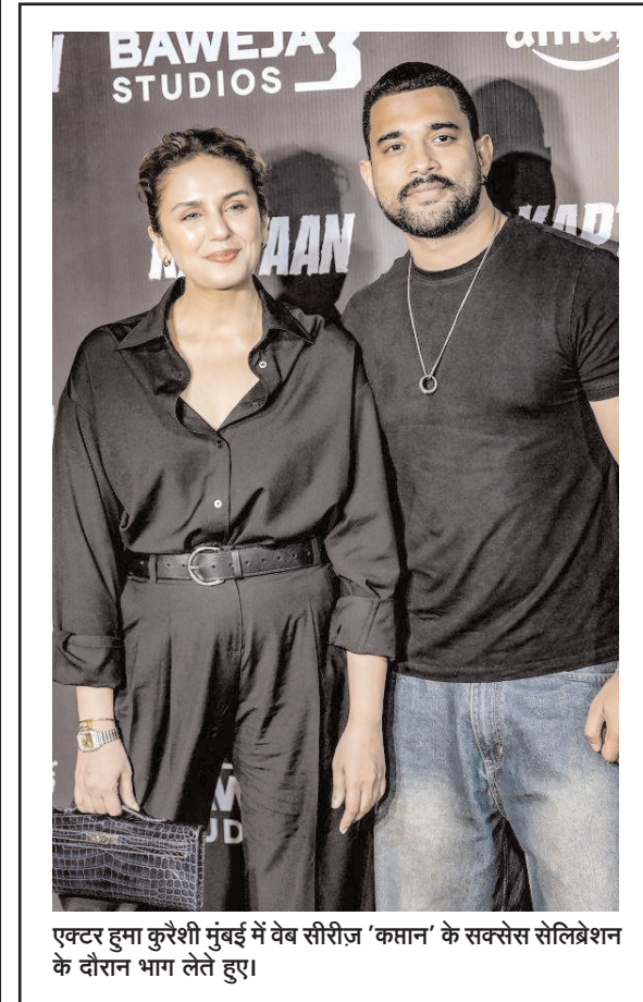
एक्टर हुमा कुरेशी मुंबई में वेब सीरीज 'कमान' के सक्सेस सेलिब्रेशन के दौरान भाग लेते हुए।

नौवहन डेटा और खुफिया जानकारी से जुड़ी कंपनी 'लॉयड्स लिस्ट इंटेलिजेंस' ने कहा कि फारस की खाड़ी में अवैध बेइंजों की आवाजाही का एक निरंतर प्रवाह रहा है, जिसमें ईरानी माल से परे 11 टैंकर भी शामिल हैं जो 13 अप्रैल से जलडमरूमध्य के बाहर ओमान की खाड़ी से रवाना हुए हैं। समुद्री खुफिया फर्म विंडवर्ड ने इस संसाह कहा कि ईरानी यातायात धोखे के माध्यम से जारी है। ईरानी पोत ट्रैकिंग डेटा में हेराफेरी करके और पाकिस्तानी जलक्षेत्र से यात्रा करके नाकाबंदी से बचने में सक्षम हैं।