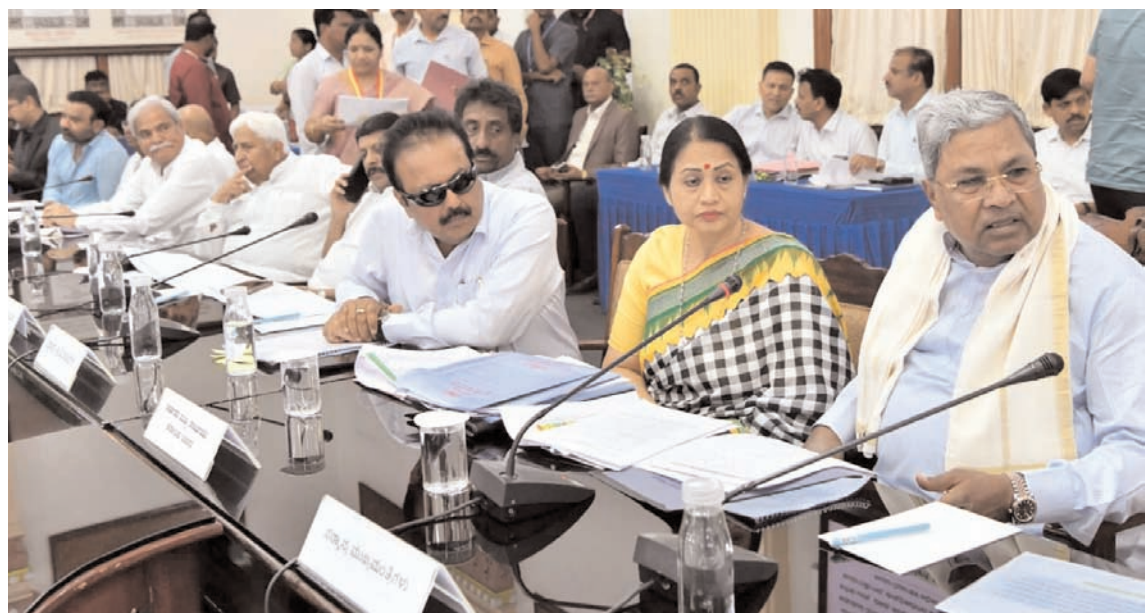
बंगलूरु में गुरवार को विधान सौधा कॉन्फ्रेंस हॉल में मुख्यमंत्री सिद्धारमय्या की अध्यक्षता में सभी जिला-प्रभारी मंत्रियों, जिला-प्रभारी सचिवों, जिला कलेक्टरों और जिला पंचायत के मुख्य कार्यकारी अधिकारियों के साथ पीने के पानी की सप्लाई, मवेशियों के चारे की स्थिति, मौसम की स्थिति और ग्रामीण और शहरी इलाकों में खेती-बाड़ी के कामों की तैयारी के बारे में एक उच्च स्तरीय बैठक की गई।