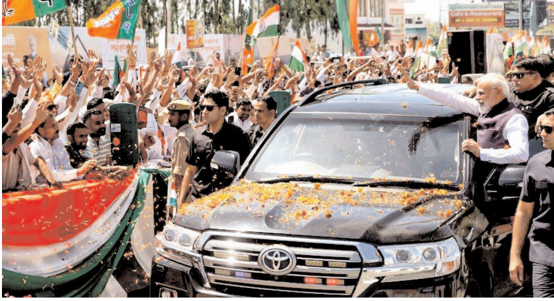
उत्तर प्रदेश के सहारनपुर में एक बड़े रोड शो के दौरान प्रधानमंत्री नरेंद्र मोदी का भीड़ से गर्मजोशी से स्वागत किया गया।