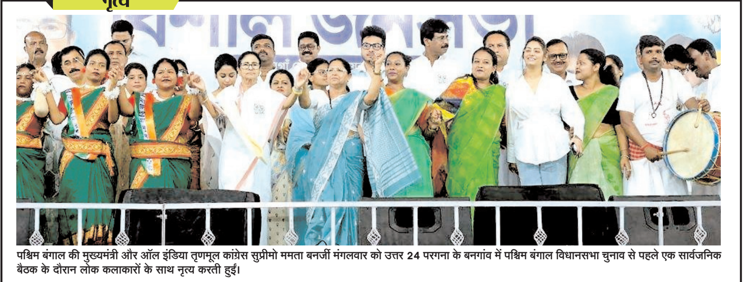
पश्चिम बंगाल की मुख्यमंत्री और ऑल इंडिया तुण्मूल कांग्रेस सुप्रियो ममता बनर्जी मंगलवार को उत्तर 24 परगना के बंगांव में पश्चिम बंगाल विधानसभा चुनाव से पहले एक सार्वजनिक बैठक के दौरान लोक कलाकारों के साथ नृत्य करती हुईं।