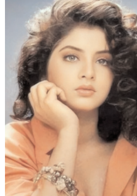
दिव्या ने अपने छोटे से करियर में शाहरुख खान और ऋषि कपूर जैसे

खो दिया। उन्होंने आगे कहा कि एक ईमानदार, बेबाक लड़की जो किसी की बकवास बर्दाश्त नहीं करती थी। खूबसूरत, साहसी और अविश्वसनीय रूप से प्रतिभाशाली... दिव्या भारती बहुत जल्दी चली गईं। दिव्या भारती की बात करें तो, यह युवा सुपरस्टार 90 के दशक के शुरुआती दौर में बॉलीवुड की सबसे होनहार अभिनेत्रियों में से एक थीं। उन्होंने बहुत कम उम्र में, कथित तौर पर किशोरावस्था में ही अपने करियर की शुरुआत की और 'दीवाना', 'शोला' और 'शबनम', 'दिक्षा' जैसी सुपरहिट फिल्मों से जल्दी ही प्रसिद्धि हासिल कर ली।