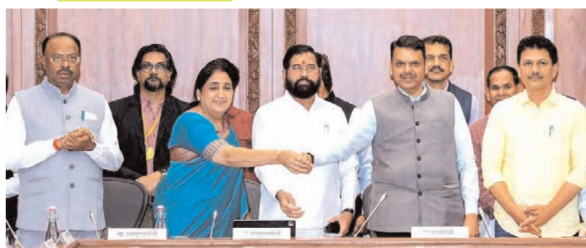
महाराष्ट्र के मुख्यमंत्री देवेंद्र फडणवीस, उपमुख्यमंत्री एकनाथ शिंदे और सुनेत्रा अजीत पवार ने मंगलवार को मुंबई के सह्याद्री गेस्ट हाउस में वर्ल्ड हेल्थ डे के मौके पर 'मेरा गांव, हेल्दी गांव' कैंपेन का उद्घाटन किया।