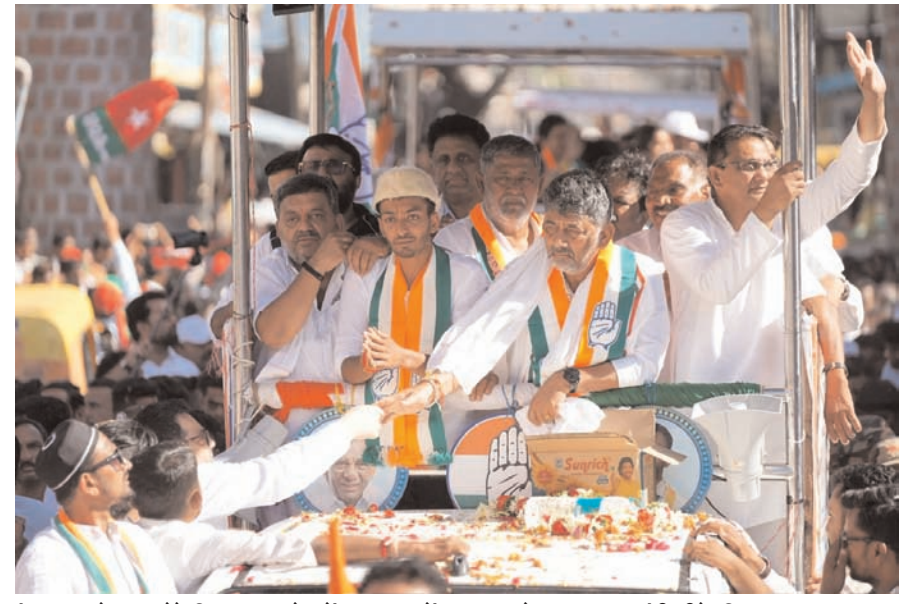
मंगलवार को दावणगेरे विधानसभा क्षेत्र में उपचुनाव में प्रचार करते हुए उपमुख्यमंत्री डीके शिवकुमार।

ऑटो और वाणिज्यिक एलपीजी की कमी के मुद्दे पर पूछे गए एक सवाल के जवाब में, शिवकुमार ने कर्नाटक से तालुकर रखने वाले केंद्रीय मंत्री प्रल्हाद जोशी से राज्य की मदद करने की अपील की। उन्होंने आरोप लगाया, पश्चिम एशिया से गैस से भरे दो जहाज भारत आए; वे सीधे गुजरात क्यों गए? दक्षिण भारत के लिए वे हमारे मंगलूर, केरल या चेन्नई बंदरगाह क्यों नहीं गए? वह (भाजपा) के नेतृत्व वाली केंद्र सरकार) केवल उत्तर भारत पर ध्यान दे रही है, दक्षिण को भूल गई है। चूंकि दक्षिण भारत में उसका (भाजपा का) कोई आधार नहीं है, इसलिए वह राजनीति कर रही है।