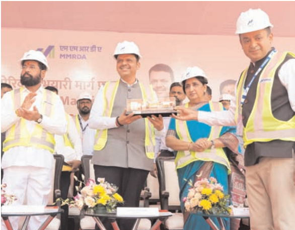
शामिल होगा। यह प्रणाली एलबीएस मार्ग, कलानगर और बीकेसी जैसे प्रमुख स्थानों को जोड़ेगी, तथा बांद्रा और कुर्ला उपनगरीय रेलवे स्टेशनों को आपस में मिलाएगी। 'पांड टैक्स' में कोई चालक नहीं होगा और एआई-आधारित यह सेवा एक खास समर्पित मार्ग पर चलेगी तथा बैटरी ऊर्जा से संचालित होगी।