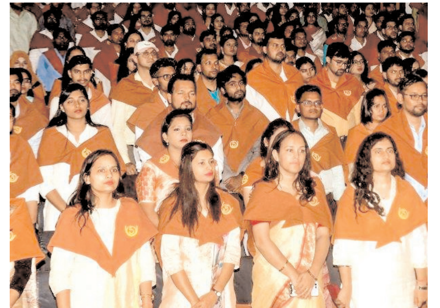
मंगलवार को पटना के रवींद्र भवन में इंदिरा गांधी नेशनल ओपन यूनिवर्सिटी के दीक्षांत समारोह के दौरान छात्र इकट्ठा हुए।