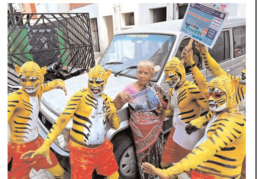
चेन्नई में 2026 के विधानसभा चुनावों से पहले मतदाता जागरूकता बढ़ाने के लिए 'ग्रेटर चेन्नई कॉर्पोरेशन' द्वारा आयोजित कार्यक्रम में बाघ की वेशभूषा में कलाकारों ने लोगों को मतदान के लिए प्रेरित किया।