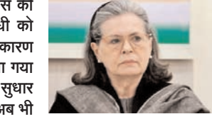
सोनिया गांधी की सेहत में सुधार हो रहा है, अब भी निगरानी में हैं: अस्पताल

पेट्रोल पंप और एलपीजी वितरकों के यहां घबराहट में खरीदारी और लंबी कतारों की खबरों के बीच, पेट्रोलियम और प्राकृतिक गैस मंत्रालय ने पश्चिम एशिया में युद्ध शुरू होने के बाद पहली बार कच्चे तेल, ईंधन और एलपीजी के भंडार का विवरण जारी किया। इसका मकसद लोगों की घबराहट को दूर करना है। सार्वजनिक क्षेत्र की पेट्रोलियम विपणन कंपनियों ने भी कहा कि पेट्रोल, डीजल या तरलीकृत पेट्रोलियम गैस (एलपीजी) की कोई कमी नहीं है और आपूर्ति स्थिर बनी हुई है। मंत्रालय ने बयान में कहा कि देश भर के सभी पेट्रोल पंप पर पर्याप्त भंडार है और वे सामान्य रूप से काम कर रहे हैं। पेट्रोल या डीजल की कोई राशनिंग नहीं की जा रही है।