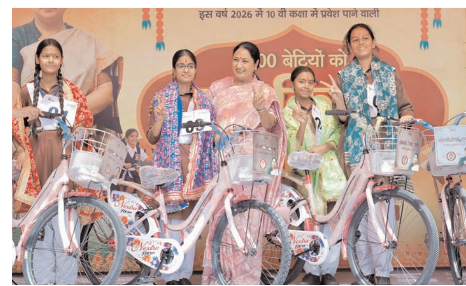
सुविधा होगी, पढ़ाई बीच में छोड़ने की दर कम होगी और माता-पिता की चिंता भी कम होगी। मुख्यमंत्री

दिल्ली की मुख्यमंत्री रेखा गुप्ता ने बृहस्पतिवार को दुर्गा अहमी के अवर पर शालीमार बाग विधानसभा क्षेत्र के एक सरकारी स्कूलों में इस वर्ष 10वीं कक्षा में प्रवेश लेने वाली 1100 छात्राओं को साइकिलें वितरित कीं। मुख्यमंत्री ने कहा कि इस पहल का उद्देश्य यह है कि छात्राओं को स्कूल आने-जाने में आसानी हो। इस कार्यक्रम के दौरान, गुप्ता ने छात्राओं को साइकिल सोंपते हुए उनसे बातचीत भी की। वह शालीमार बाग विधानसभा क्षेत्र से ही विधायक हैं। उन्होंने पत्रकारों से कहा, हमने देखा है कि कभी-कभी लड़कियों को घर से स्कूल जाने में