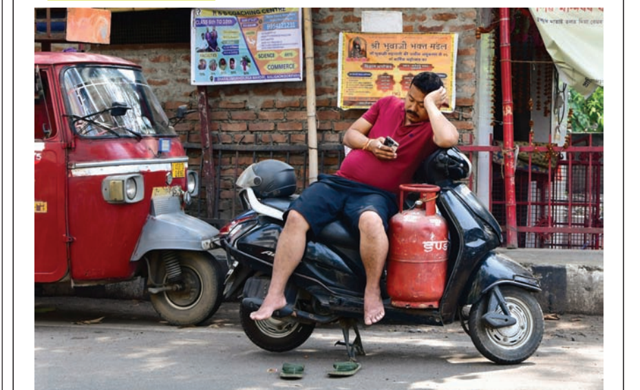
गुरुवार को असम के गुवाहाटी में जारी एलपीजी आपूर्ति संकट के बीच एक व्यक्ति दोपहिया वाहन पर खाली गैस सिलेंडर लेकर रिफिल के इंतजार में बैठा हुआ।