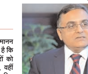
सबसे तेजी से बढ़ते नागर विमानन बाजारों में से एक हैं और इस क्षेत्र को बढ़ावा देने के लिए सरकार तथा नियामक संस्थाएं लगातार कदम उठा रही हैं।

नई दिल्ली/बाधा। नागर विमानन महानिदेशालय (डीजीसीए) ने कहा है कि वह एक ओर यात्रियों के अधिकारों को मजबूत करने पर ध्यान दे रहा है, वहीं दूसरी ओर एयरलाइन कंपनियों के लिए कामकाज को आसान बनाने के प्रयास भी कर रहा है, ताकि वे आगे बढ़ सकें और बेहतर प्रदर्शन कर सकें।