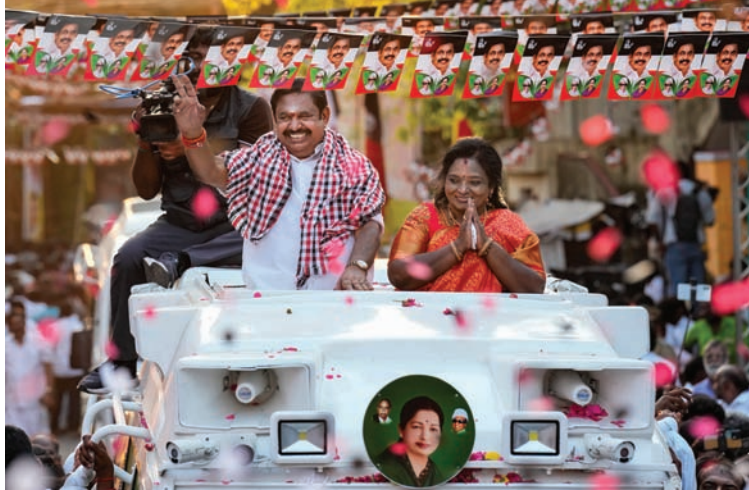
तमिलनाडु विधानसभा में विपक्ष के नेता और एआईएडीएमके प्रमुख एडम्पाडी के. पलानीस्वामी तथा भाजपा नेता एवं पूर्व तेलंगाना राज्यपाल तमिलिसाई सौंदरराजन बुधवार को चेन्नई जिले के मायलापुर विधानसभा क्षेत्र में राज्य विधानसभा चुनाव से पहले आयोजित रोडशो के दौरान।