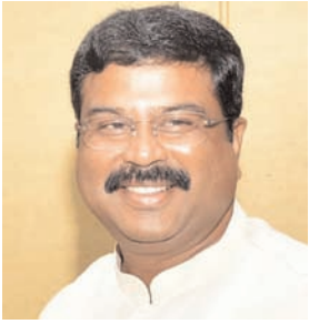
प्रधान ने कहा कि देश में इस समय लगभग 60 प्रतिशत हाई स्कूल ब्राडबैंड इंटरनेट कनेक्शन से जुड़े हुए हैं। उन्होंने कहा, अगले 2-3 साल में देश के सभी हाई स्कूल ब्राडबैंड इंटरनेट कनेक्शन से जुड़ जाएंगे। एआई पर मंत्री ने कहा कि देश इस तकनीक में सबसे आगे है। प्रधान ने कहा, एआई एक ऐसा विषय है जो विभिन्न क्षेत्रों में प्रयुक्त है। आज, जब हम राष्ट्रीय शिक्षा नीति के नए पाठ्यक्रम को लागू कर रहे हैं... एआई का प्राथमिक ज्ञान कक्षा तीन से होगा। उन्होंने कहा कि स्कूली पाठ्यक्रम में इसकी भूमिका पर जोर दिया गया है। आवश्यक विषयों, कौशल और क्षमता आदि के पाठ्यचर्या एकीकरण के तहत, उभरी प्रौद्योगिकियों के बारे में बात

प्रधान ने कहा कि देश में इस समय लगभग 60 प्रतिशत हाई स्कूल ब्राडबैंड इंटरनेट कनेक्शन से जुड़े हुए हैं। उन्होंने कहा, अगले 2-3 साल में देश के सभी हाई स्कूल ब्राडबैंड इंटरनेट कनेक्शन से जुड़ जाएंगे। एआई पर मंत्री ने कहा कि देश इस तकनीक में सबसे आगे है। प्रधान ने कहा, एआई एक ऐसा विषय है जो विभिन्न क्षेत्रों में प्रयुक्त है। आज, जब हम राष्ट्रीय शिक्षा नीति के नए पाठ्यक्रम को लागू कर रहे हैं... एआई का प्राथमिक ज्ञान कक्षा तीन से होगा। उन्होंने कहा कि स्कूली पाठ्यक्रम में इसकी भूमिका पर जोर दिया गया है। आवश्यक विषयों, कौशल और क्षमता आदि के पाठ्यचर्या एकीकरण के तहत, प्रदर्शकों की सरकारों के दायरे में आते हैं। प्रधान ने कहा, राष्ट्रीय शिक्षा नीति (एनईपी) 2020 में कृत्रिम बुद्धिमत्ता (एआई) के महत्व और स्कूली पाठ्यक्रम में इसकी भूमिका पर जोर दिया गया है। आवश्यक विषयों, कौशल और क्षमता आदि के पाठ्यचर्या एकीकरण के तहत, उभरी प्रौद्योगिकियों के बारे में बात