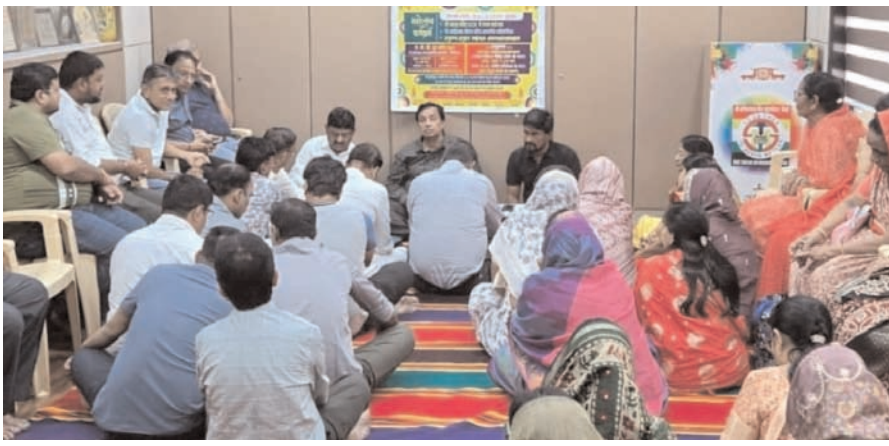
महावीर जन्म कल्याणक