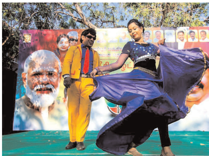
चेन्नई में तमिलनाडु विधानसभा चुनाव के लिए एआईएडीएमके (-च-उम्रघ) महासचिव एडम्पादी के. पलानीस्वामी (जो दिखाई नहीं दे रहे हैं) के चुनाव अभियान के दौरान कलाकार प्रस्तुति देते हुए।