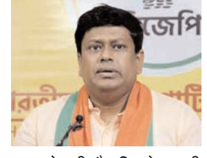
ध्यान दे रही है, जिससे चुनावी गणित बदल सकता है। मजूमदार ने 2026 के विधानसभा चुनावों को राज्य के लिए एक जनसांख्यिकीय निर्णायक मोड़ करार दिया। उन्होंने कहा, जनगणना अभी नहीं हुई है, लेकिन ममता बनर्जी ने खुद कहा है कि मुस्लिम आबादी लगभग 33 प्रतिशत है, जो 33-35 प्रतिशत तक हो सकती है। अगले पांच वर्षों में यह और बढ़ेगी। इसके बाद हिंदूओं के लिए चुनावी जीतना मुश्किल हो जाएगा। मजूमदार ने यह भी दावा किया कि यदि टीएमसी सत्ता में बनी रहती है, तो 2026 का चुनाव ऐसा आखिरी चुनाव हो सकता है जिसमें बंगाली हिंदू राज्य की चुनावी दिशा तय करने में निर्णायक भूमिका निभाएंगे। केंद्रीय मंत्री ने दावा किया, "जनसांख्यिकी में बदलाव के कारण टीएमसी को धीरे-धीरे हिंदूओं के बजाय मुसलमानों का अधिक टिकट देने के लिए मजबूर होना पड़ेगा। मुस्लिम उपमुख्यमंत्री की मांग अभी से सुनाई दे रही है। ये मांगें भविष्य में पूरी होंगी और अंततः इससे मुस्लिम मुख्यमंत्री बनने का रास्ता साफ हो सकता है।" इतिहास का हवाला देते हुए, मजूमदार ने विभाजन के दौरान हुई सांप्रदायिक हिंसा और मुस्लिम लीग के सत्ता में रहने के दौरान हुए 'ग्रेट कलकत्ता हत्याकांड' का जिक्र किया। भाजपा लंबे समय से आरोप लगाती रही है कि सीमावर्ती जिलों में जनसंख्या में बदलाव राज्य की रणनीति को प्रभावित कर रहा है और इसी मुद्दे को पार्टी 2026 चुनाव के लिए प्रचार अभियान का प्रमुख विषय बना रही है।

दक्षिण भारत राष्ट्रमत dakshinbharat.com कोलकाता/भाषा। केंद्रीय मंत्री सुकांत मजूमदार ने दावा किया है कि पश्चिम बंगाल में तुणमूल कांग्रेस (टीएमसी) के शासनकाल के दौरान तेजी से हो रहे जनसांख्यिकीय बदलाव के कारण कई जिलों में हिंदू अल्पसंख्यक बन सकते हैं, जिससे भविष्य में हिंदू उन्मीदवारों के लिए चुनाव जीतना कठिन हो जाएगा। भाजपा की बंगाल इकाई के पूर्व अध्यक्ष मजूमदार ने दिए एक साक्षात्कार में कहा कि 2021 के विधानसभा चुनाव में सत्ता हासिल करने में असफल रहने के बाद भाजपा ने अपनी रणनीति में बदलाव किया है। उन्होंने बताया कि पार्टी अब बुद्ध स्तर पर संगठन को मजबूत करने, बंगाल-केंद्रित मुद्दों को आगे बढ़ाने और विशेष गहन पुनरीक्षण (एसआईआर) के माध्यम से मतदाता सूची को शुद्ध करने पर