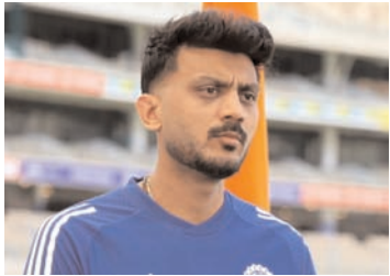
टीम में किसी हरफनमौला को चुनना मुश्किल हो गया है, जब तक कि वह बल्ले और गेंद दोनों से समान रूप से अच्छा न हो। भारतीय टी20 टीम के उपकप्तान ने 'इंपैक्ट प्लेयर' से जुड़े 'पीटीआई' के सवाल के जवाब में हंसते हुए कहा, "मुझे यह नियम पसंद नहीं है, क्योंकि मैं खुद एक ऑलराउंडर हूँ। पहले हम इस भूमिका (बल्लेबाजी और गेंदबाजी) के लिए ऑलराउंडर चुनते थे। अब टीम प्रबंधन किसी खास बल्लेबाज या गेंदबाज को चुनता है। वे कहते हैं कि हमें ऑलराउंडर की क्या जरूरत है?" उन्होंने कहा, "खुद एक ऑलराउंडर होने के नाते मुझे यह पसंद नहीं है, लेकिन साथ ही नियम तो नियम होते हैं। हमें उनका पालन करना होता है। व्यक्तिगत रूप से मुझे यह पसंद नहीं है।"

दक्षिण भारत राष्ट्रमत dakshinbharat.com नई दिल्ली/भाषा। भारतीय हरफनमौला और दिल्ली कैपिटल्स के कप्तान अक्षर पटेल ने इंडियन प्रीमियर लीग (आईपीएल) के 'इंपैक्ट प्लेयर' नियम की आलोचना करते हुए कहा, "मुझे यह पसंद नहीं है, क्योंकि इससे उनके जैसे खिलाड़ियों (हरफनमौला) के विकास में बाधा आती है। रोहित शर्मा और हार्दिक पंड्या भी 'इंपैक्ट प्लेयर' नियम के खिलाफ बोल चुके हैं, जिसके तहत टीमें मैच के किसी भी समय अपनी एकादश में किसी खिलाड़ी को सूचीबद्ध पांच खिलाड़ियों में से किसी एक से बदल सकती हैं। यह नियम 2023 में लागू हुआ था और कम से कम 2027 तक लागू रहेगा। रोहित ने 2024 में कहा था कि उन्हें यह रणनीतिक नियम पसंद नहीं है, क्योंकि इससे भारतीय क्रिकेट में अंतरराज्य अल्पमता के विकास में बाधा आती है। इसके अगले सत्र में हार्दिक ने कहा था कि