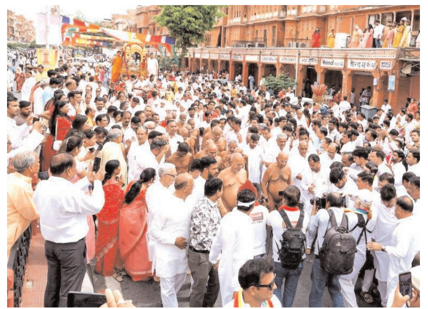
महावीर जयंती के अवसर पर भोपाल की सड़कों पर निकली भव्य शोभायात्रा। भक्ति और उत्साह का संगम।