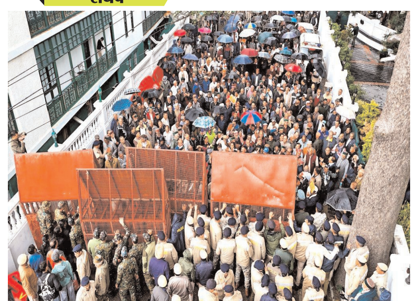
शिमला में बजट सत्र के दौरान विधानसभा की ओर बढ़ रहे पेंशनर्स को पुलिस ने रोका। हक के लिए संघर्ष जारी।