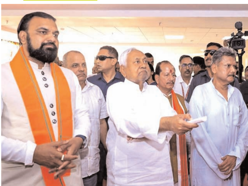
मुख्यमंत्री नीतीश कुमार ने नए प्रशासनिक और शैक्षणिक भवन का उद्घाटन किया। बिहार में शिक्षा के बुनियादी ढांचे को मिलेगी मजबूती।