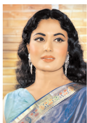
माहौल एकदम तनावपूर्ण हो गया। पहले तो सभी को लगा कि अब लूटपाट हो सकती है। लेकिन जैसे ही उन लोगों को यह पता चला कि गाड़ी में बेटी महिला मजहूर

मुताबिक, यह घटना उस समय की है जब मीना कुमारी अपने पति और फिल्म निर्माता कमाल अमरोही के साथ शूटिंग के सिलसिले में यात्रा कर रही थीं। बताया जाता है कि मध्य प्रदेश के शिवपुरी इलाके से गुजरते समय उनकी कार का पेट्रोल अचानक खत्म हो गया। चारों तरफ सन्नाटा था, दूर-दूर तक कोई नहीं था और रात भी हो चुकी थी। ऐसे में उन्होंने वहीं रुककर सुबह होने का इंतजार करने का फैसला किया। लेकिन उन्हें इस बात का अंदाजा नहीं था कि यह इलाका उस समय डाकूओं के लिए कुख्यात माना जाता था। रात करीब दो बजे अचानक कुछ हथियारबंद लोग वहां पहुंचे और उन्होंने गाड़ियों को घेर लिया।