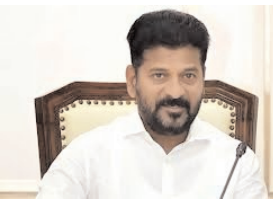
दक्षिण भारत राष्ट्रमत

हैदराबाद/बाधा। तेलंगाना के मुख्यमंत्री ए रेवंत रेड्डी ने कहा है कि राज्य सरकार कुत्रिम मेधा (एआई) कंपनियों पर कर लगाने की नीतियों पर विचार कर रही है ताकि इसके कारण नौकरियों गंवाने वाले लोगों को मुआवजा दिया जा सके। रेड्डी ने अमेरिका स्थित 'हार्वर्ड केनेडी स्कूल' की कुत्रिम मेधा (एआई) संशोधी को शुक्रवार रात डिजिटल माध्यम से संबोधित करते हुए एआई को "दो धारी तलवार" बताया और सचेत किया कि अगर इसका शुरुआत में ही प्रबंधन नहीं किया गया तो इसके जोखिम इसके लाभ से अधिक हो सकते हैं। 'हार्वर्ड केनेडी स्कूल' में हाल