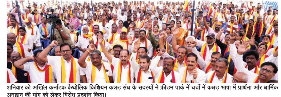
शनिवार को अखिल कर्नाटक कैथोलिक क्रिश्चियन कन्नड़ संघ के सदस्यों ने फ्रीडम पार्क में चर्चों में कन्नड़ भाषा में प्रार्थना और धार्मिक अनुष्ठान की मांग को लेकर विरोध प्रदर्शन किया।