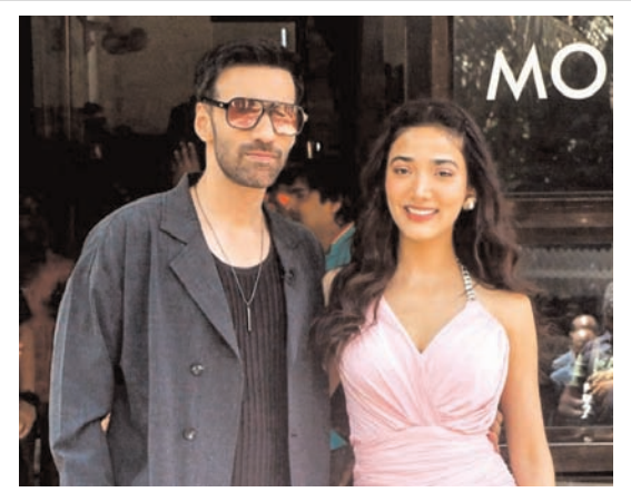
मुंबई की गलियों में सितारों की घमक! बॉलीवुड कलाकार मेधा शंकर और अविनाश तिवारी आज अंधेरी में पैपराजी के कैमरों में कैद हुए।